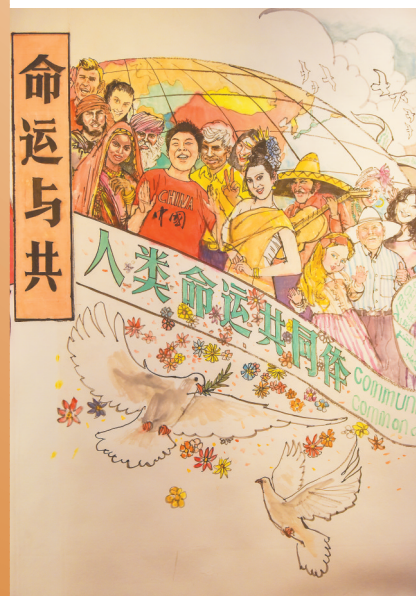
书画卷中的《命运与共》篇