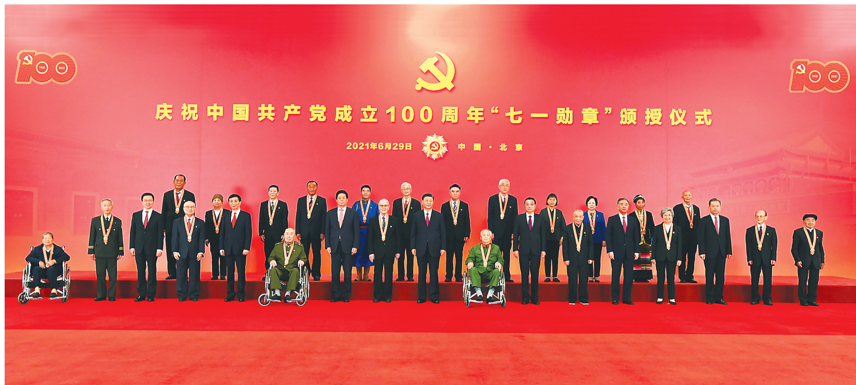
6月29日，庆祝中国共产党成立100周年“七一勋章”颁授仪式在北京人民大会堂金色大厅隆重举行。习近平等领导同志同“七一勋章”获得者合影。新华社记者 谢环驰 摄

习近平向“七一勋章”获得者颁授勋章并发表重要讲话 会见全国“两优一先”表彰对象 李克强栗战书汪洋王沪宁赵乐际韩正王岐山出席活动