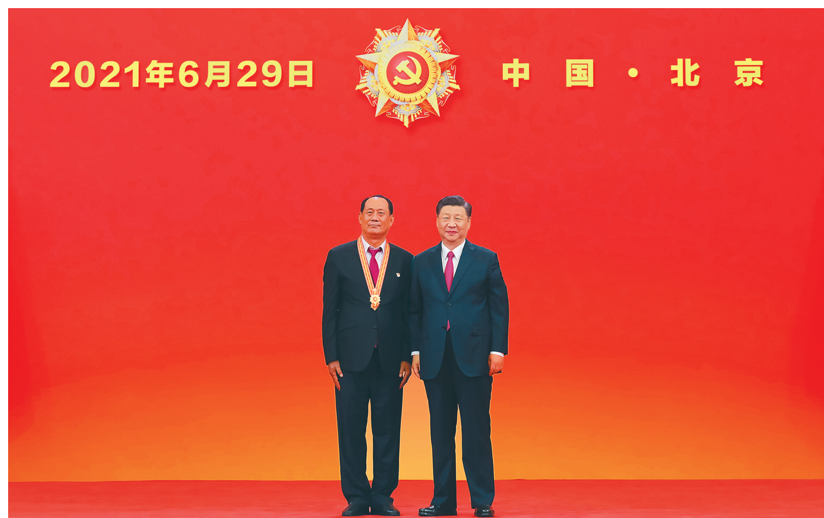
中共中央总书记、国家主席、中央军委主席习近平向“七一勋章”获得者王书茂颁授勋章。