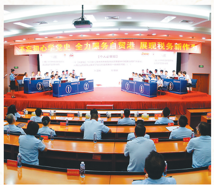
海南省税务局举办“学党史 强技能”党史知识竞赛决赛。