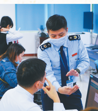
海南省税务局着力打造智能高效的电子税务局，实现99%纳税申报业务网上办、掌上办、自助办。图为税务干部辅导纳税人通过手机办理涉税业务。