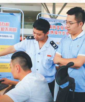
海南省税务部门积极开展“我为纳税人缴费人办实事”活动，图为税务干部上门对企业进行车购税宣传辅导。

为庆祝中国共产党成立100周年，进一步做好海南省税务系统群众性主题宣传教育，今年以来，全省税务系统将党史学习教育作为重大政治任务扛牢抓实，积极开展学习辅导、参观交流、诵读演讲、音频视频、文艺表演等一系列丰富多彩、主题鲜明的活动，让党史学习教育活起来、新起来、动起来，通过深学细研，引导海南税务党员干部不断从党的百年光辉历程中汲取经验智慧和力量，持续将学习成果转化为纳税人缴费人办实事、解难题的工作动力，为海南自贸港建设不断贡献税务力量。