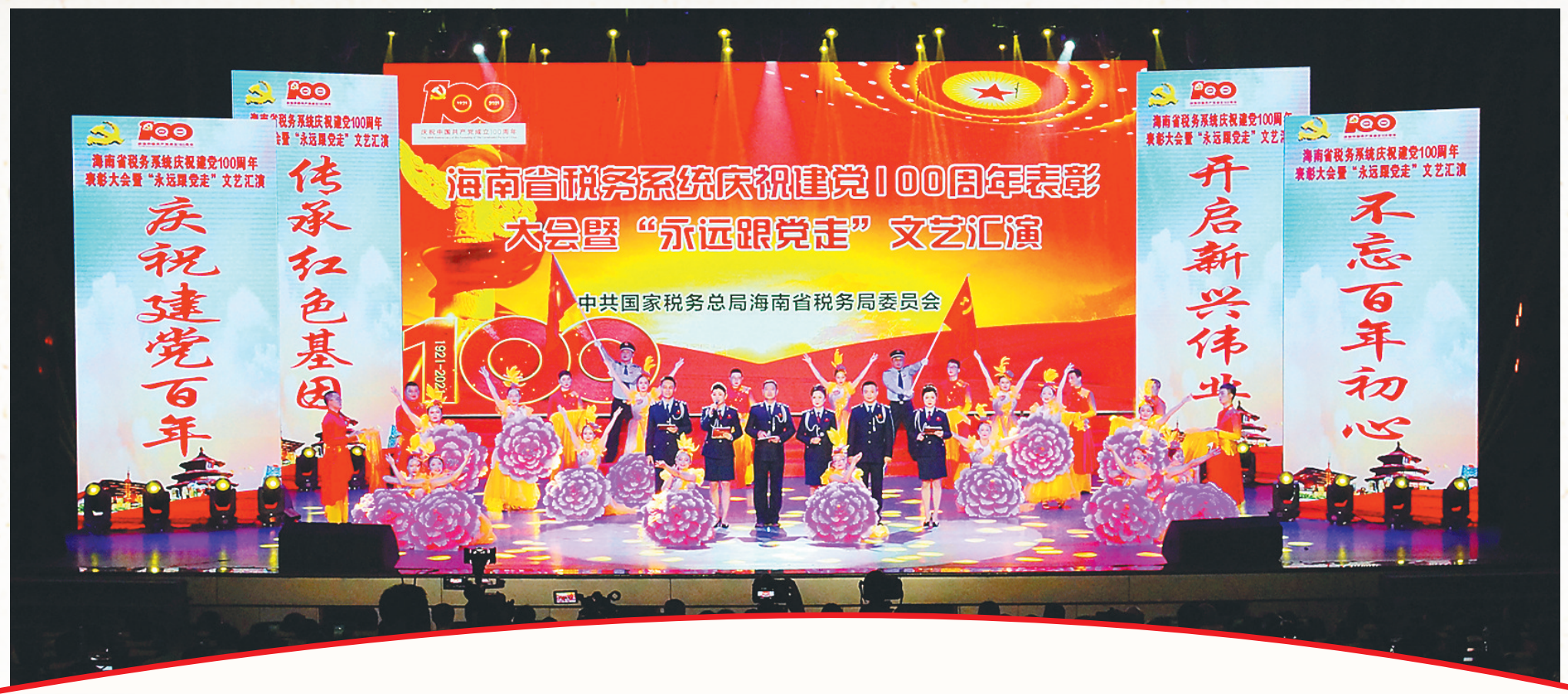
国家税务总局海南省税务局举行庆祝建党一百周年表彰大会暨“永远跟党走”大型文艺汇演。

6月29日，国家税务总局海南省税务局庆祝建党100周年表彰大会暨“永远跟党走”大型文艺汇演在海口精彩上演。此次文艺汇演全部节目均由税务干部出演，以讴歌中国共产党、歌颂祖国、唱响新时代、赞美海南为主题，展现中国共产党走过的100年光辉历程和取得的辉煌成就，颂扬“二十三年红旗不倒”的琼崖革命精神和海南敢闯敢试、敢为人先、埋头苦干的特区精神，展现海南税务人对伟大祖国、美丽家乡的热爱和对美好生活的向往。汇演期间，与会领导还为“光荣在党50年”的老党员以及全省税务系统优秀共产党员、优秀党务工作者、先进基层党组织颁奖。