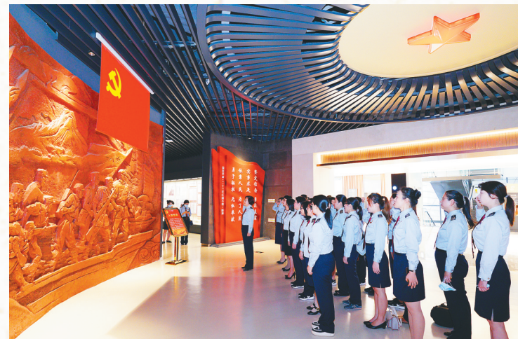
海口市税务局干部在省史志馆重温入党誓词。