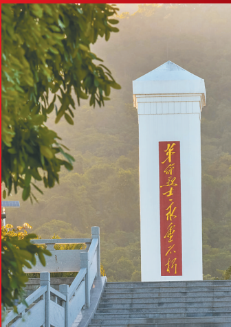
万宁六连岭烈士陵园。