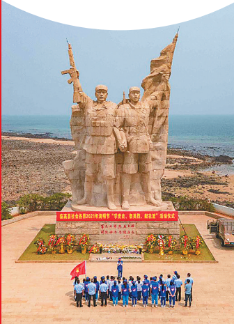
海南解放公园。

★周边游玩推荐:“航天文昌·飞天梦想”精品路线日前入选文化和旅游部、中央宣传部、中央党史和文献研究院、国家发展改革委联合发布的“建党百年红色旅游百条精品线路”。可以按照“海南省文昌航天发射基地—文昌航天科普馆—文昌航天主题公园—文昌龙楼航天小镇—文昌淇水湾”这一路线,走近大国重器、感受中国力量。