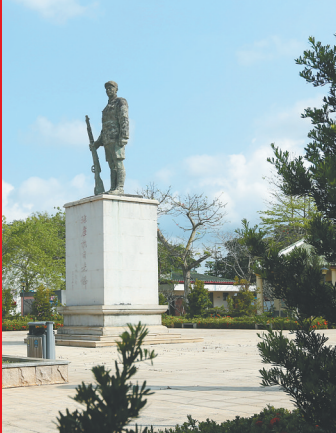
琼崖红军云龙改编旧址。