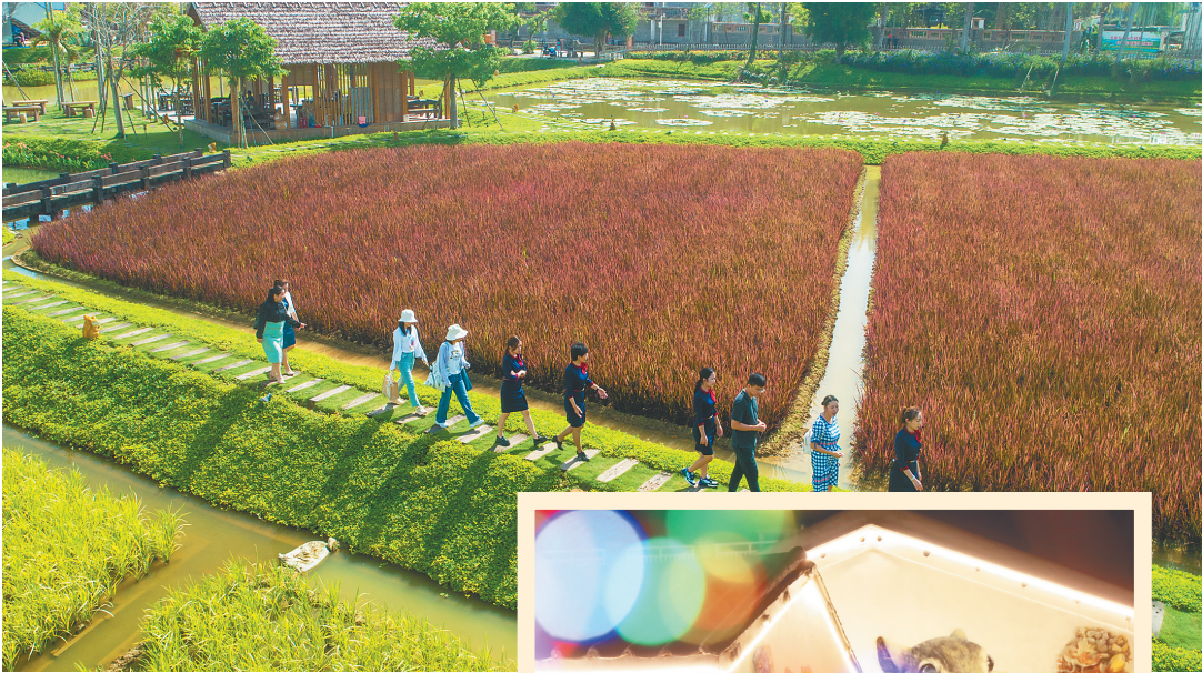
在琼海市博鳌镇的留客村，游客畅游美丽乡村。