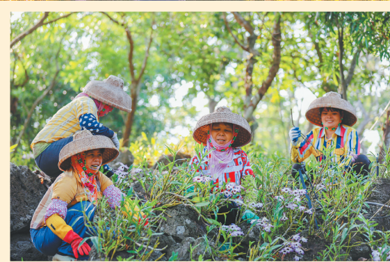
在海口市石山镇施茶村的火山石斛园，村民在清理枯枝落叶。