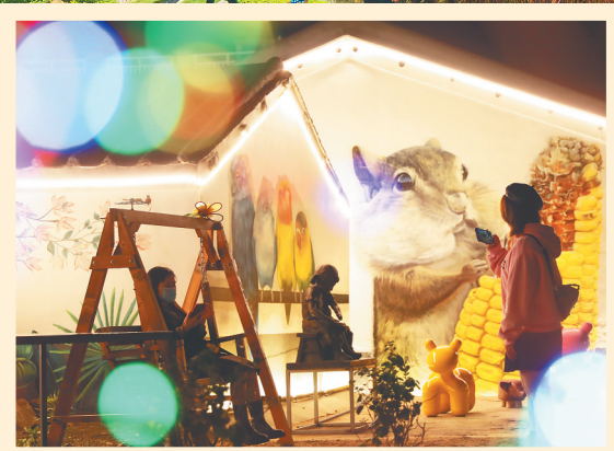
海口江东新区权拥东村吸引游客“打卡”拍照。