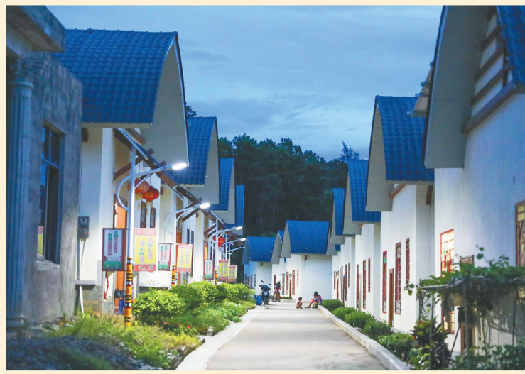
夜幕降临，琼中营根镇朝参村的路灯亮起。