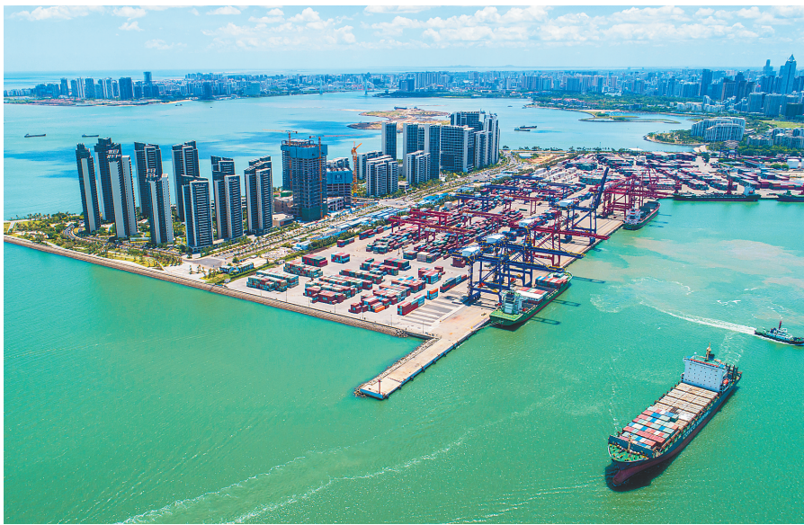
↑在海口港集装箱码头,一艘装着集装箱的货轮出港。