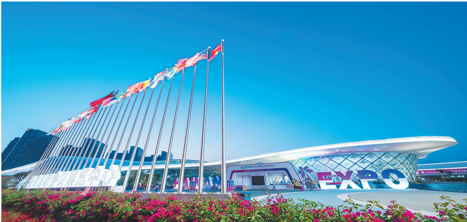
←夜幕下的海南国际会展中心。