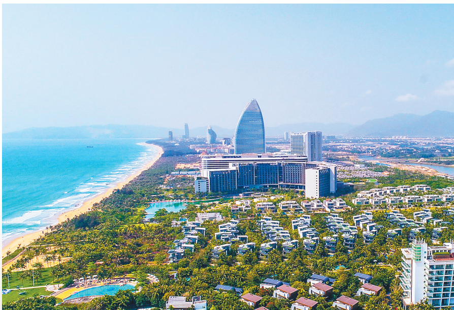
↑航拍三亚市海棠湾酒店建筑群,景观尽收眼底。