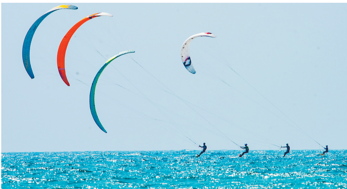
↑游客在博鳌 海滨体验风筝冲浪 的乐趣。