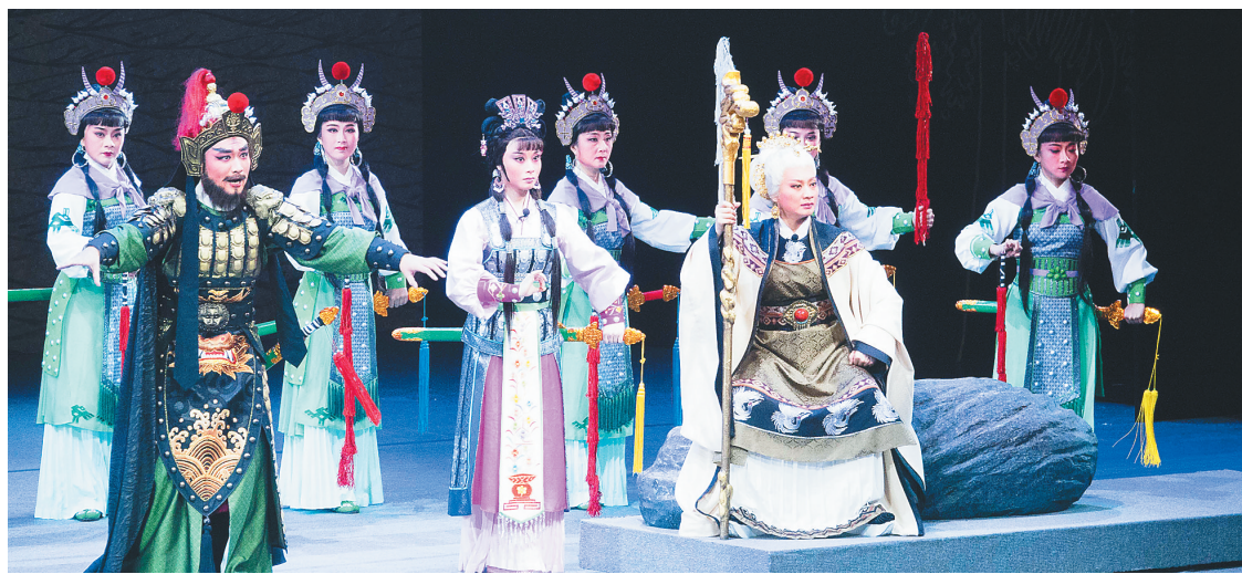
↑ 2018年3月9日,我省原创历史琼剧《冼夫人》在省歌舞剧院演出。