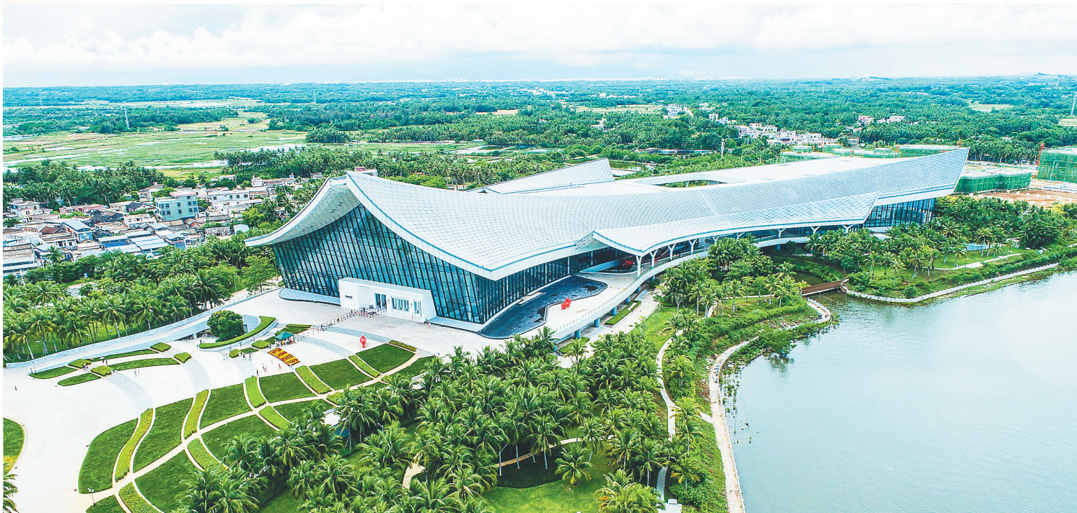
← 航拍中国(海南)南海博物馆。