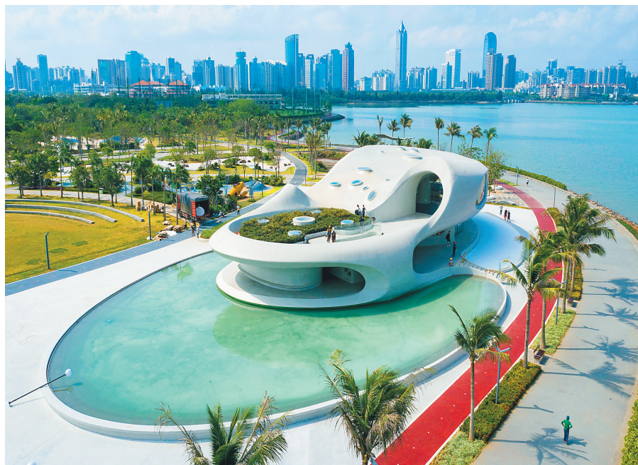
↑ 海口云洞图书馆。