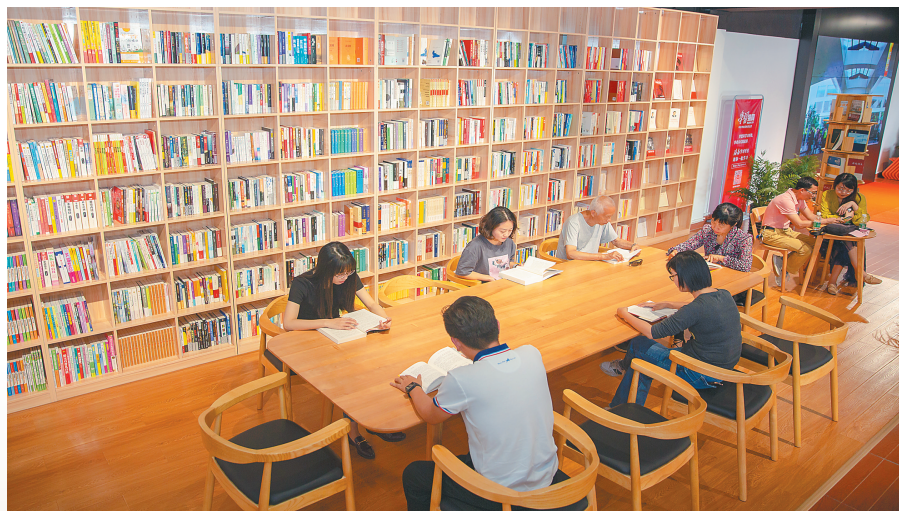
↑ 市民在琼海市新时代文明实践中心万泉河分中心看书。