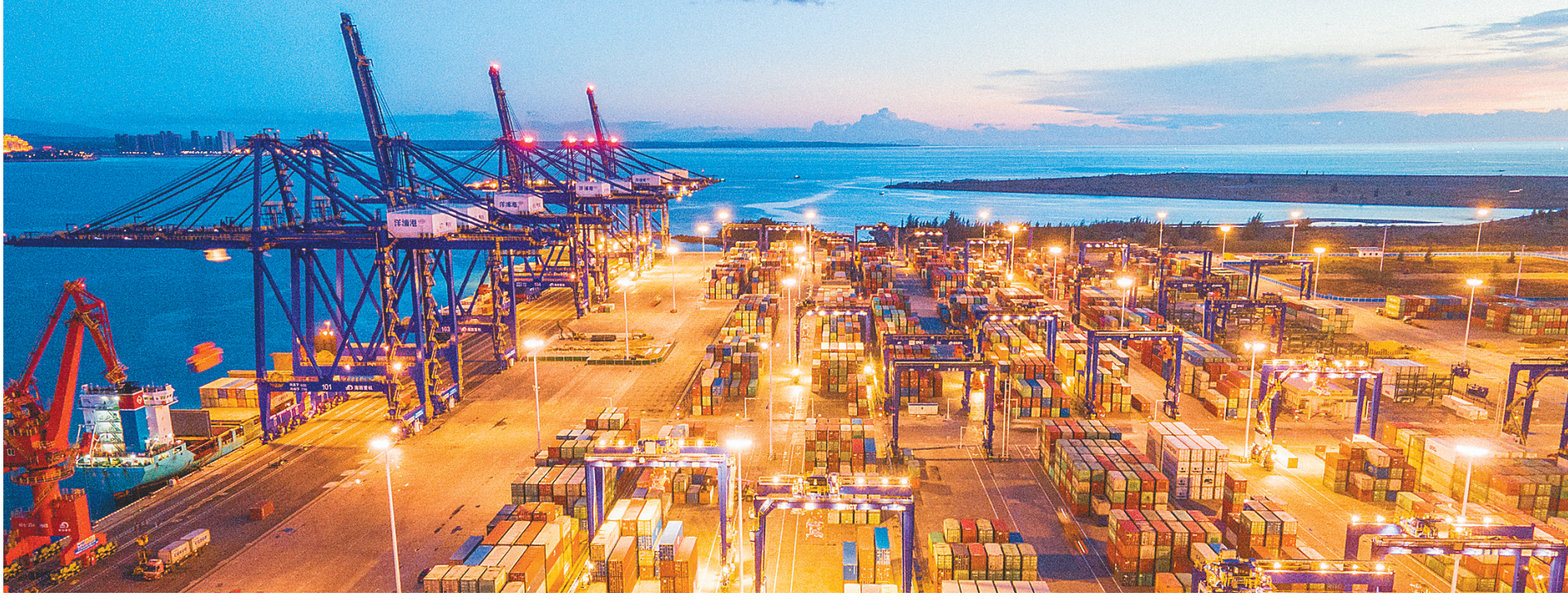
5月26日,洋浦经济开发区国际集装箱码头一派繁忙景象。

在海南建设中国特色自由贸易港,是习近平总书记亲自谋划、亲自部署、亲自推动的改革开放重大举措,是海南全省上下必须了然于胸、成竹于胸的“国之大者”。“4·13”以来,海南大力弘扬敢闯敢试、敢为人先、埋头苦干的特区精神,认真贯彻落实习近平总书记关于海南工作的系列重要讲话和指示批示精神及《海南自由贸易港建设总体方案》(以下简称《总体方案》),统筹常态化疫情防控和经济社会发展,推动全面深化改革开放生机勃勃,自由贸易港建设蓬勃展开。