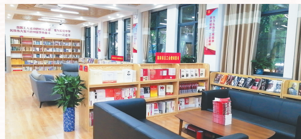
昌江黎族自治县总工会职工书屋。

以提高服务职工的效能为目的,进一步健全职工之家阵地建设的联动机制。海南省工会系统条线联动,省、市、县总工会牵头部门加强整体谋划、顶层设计、综合协调,建立阵地建设落实协调推进机制;上下联动,各级工会加强阵地建设的联动,形成多层次、多渠道、多形式的服务职工阵地体系;党政联动,积极争取各级党政的重视和支持,努力将工会职工之家阵地建设纳入党和政府(行政)民生工作全局,纳入党政的整体规划、纳入党政实事项目;社会联动,调动和整合更多社会资源,充分利用社会机构的工作平台和服务资源,争取基层单位行政支持,为职工之家阵地建设提供必要场所和条件,不断开发拓展职工之家阵地发展空间。