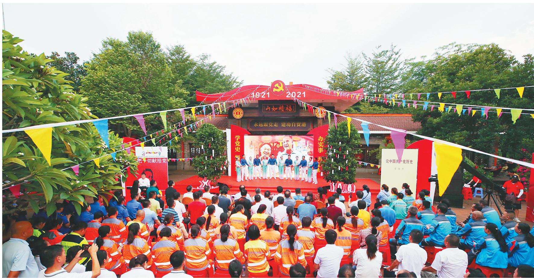
二〇二一年六月十一日,全国职工党史学习教育活动海南专场在海口举行。

特别是自今年启动党史学习教育以来,海南省总工会坚决贯彻落实党中央和省委的决策部署,以强烈的责任感和紧迫感,筹谋在前,闻令而动,尽锐出战,坚持“规定动作”做到位、“自选动作”求创新,一步一个脚印扎实开展各项工作,引导广大职工群众和工会干部学党史、悟思想、办实事、开新局,以昂扬姿态投身海南全面深化改革和自由贸易港高质量发展的主战场。