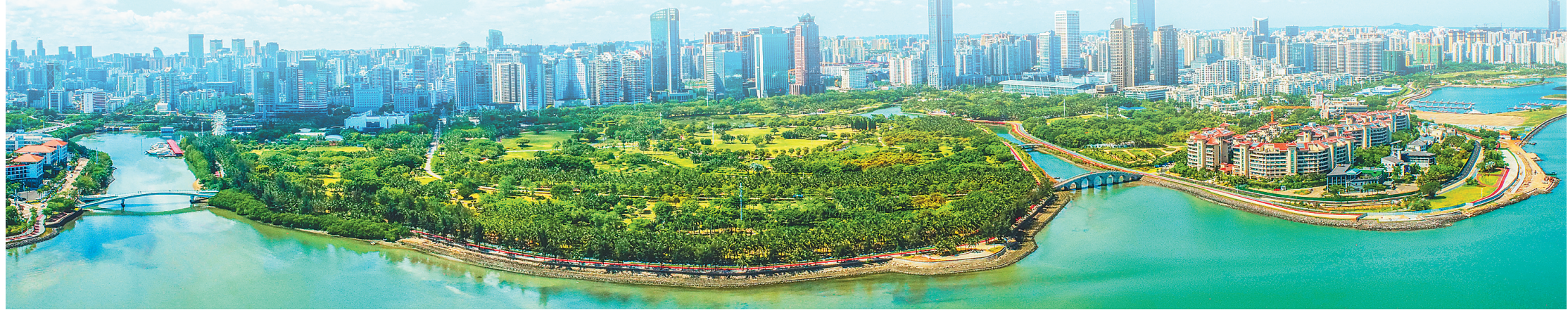
蓝天白云下的海口市万绿园,带城市新貌。