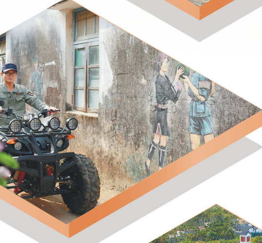
定安马郎田村彩绘壁画讲述党史。