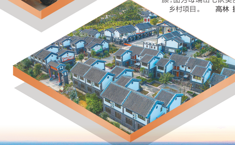
定安革命老区换新颜，图为母瑞山七队美丽乡村项目。