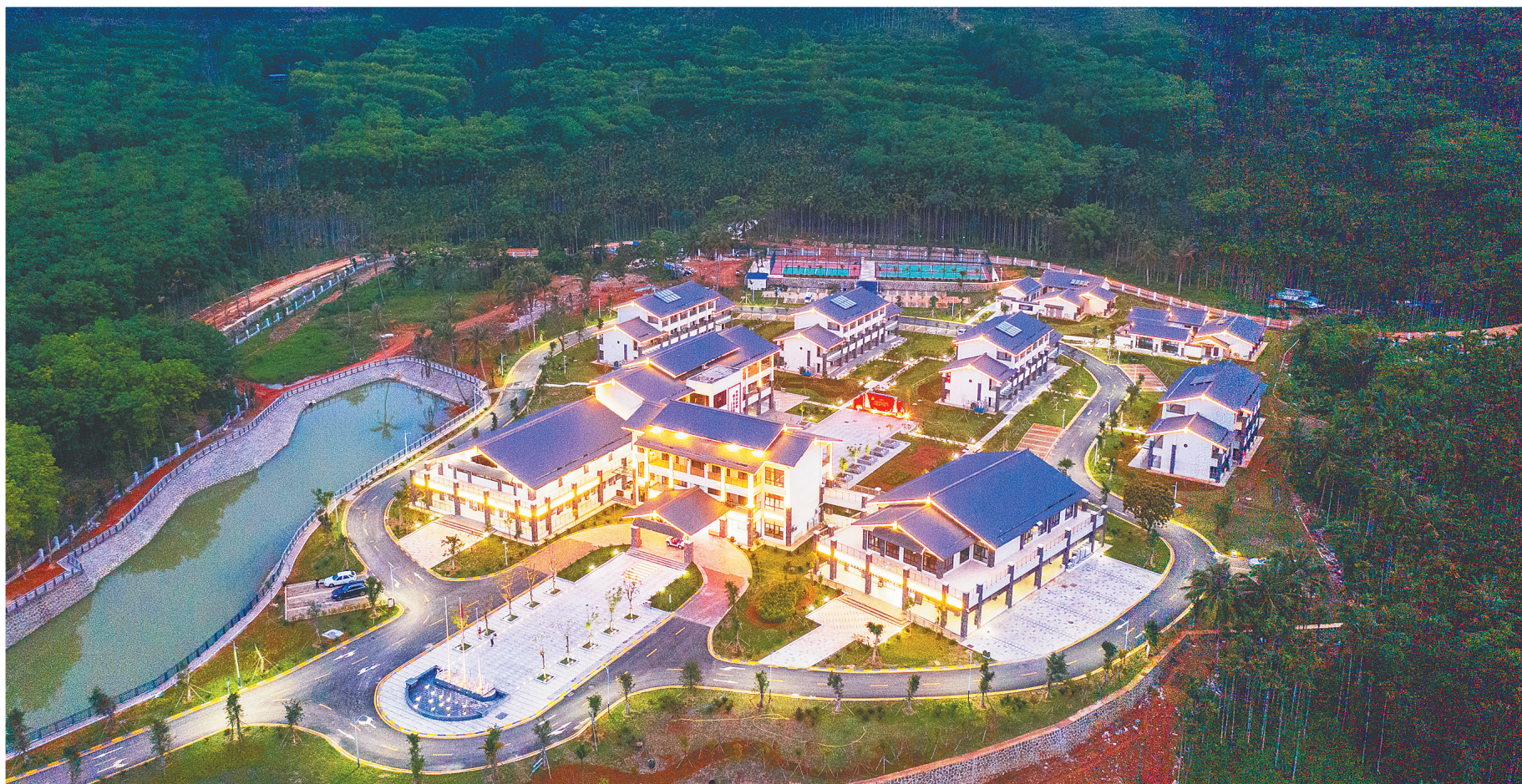
母瑞山干部学院(筹)一期项目。

唱响琼剧讲党史，大榕树下话初心，沉到基层作宣讲，田间地头上课……今年3月以来，定安通过多种形式深入推进党史学习教育，让党员群众愿意听、听得懂、记得住，让党史学习教育既接地气，又入人心，在赓续红色精神的同时，也让党史学习教育不断往深里走、往心里去、往实里做。