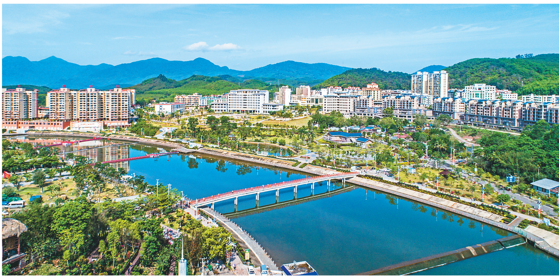
航拍白沙县城南叉河两岸景观

近年来,白沙赓续红色基因,解放思想、敢闯敢试,抢抓海南自由贸易港建设重大机遇,探索“绿水青山就是金山银山”的白沙路径,带领黎族苗族群众决战决胜脱贫攻坚,推动白沙实现了从贫穷落后到全面小康的历史性跨越;同时,不断增进民生福祉,持续为广大百姓幸福加码。