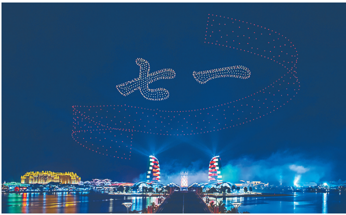
无人机组成的“七一”图案。