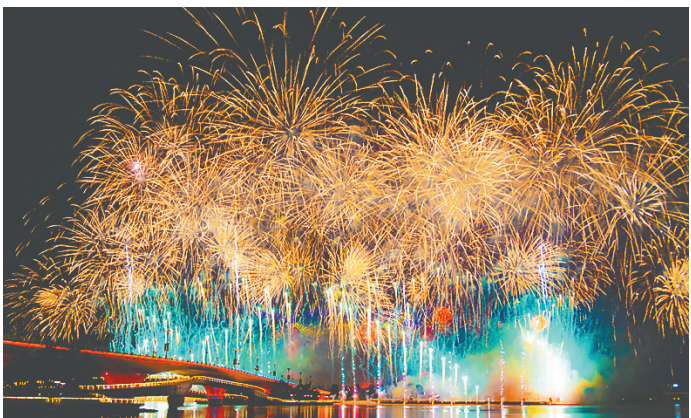
烟花表演。

灯光璀璨，星辰添彩。6月30日晚，随着倒计时“5、4、3、2、1”特效闪变，恒大海花岛光影烟花秀《感恩伟大的党》璀璨亮相！ 苍穹为幕，光影为笔。当晚，光影烟花秀时长7分钟，以灯光+烟火+1200架无人机的形式，在夜空中铺展出一幅幅震撼人心的红色画卷。 伴随《唱支山歌给党听》《没有共产党就没有新中国》等慷慨激昂的红色经典音乐，金光闪闪的党徽、迎风飘扬的党旗、穿越百年风雨的红船、巍峨宏伟的长城、蛟龙号载人潜水器、“七一”“中国共产党万岁”“人民万岁”等图案和文字相继呈现。 此次光影烟花秀共分为《开天辟地 光辉历程》《赓续传承 砥砺前行》《百年华诞 党在我心》三个篇章，为市民游客呈现了一场精彩纷呈的视觉盛宴。