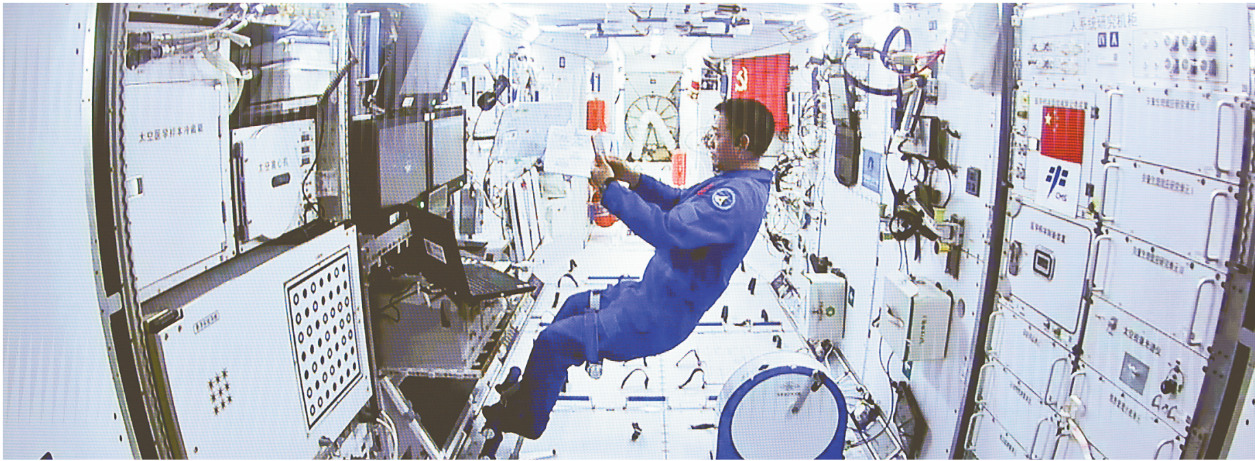
舱内航天员聂海胜配合支持两名出舱航天员开展舱外操作。