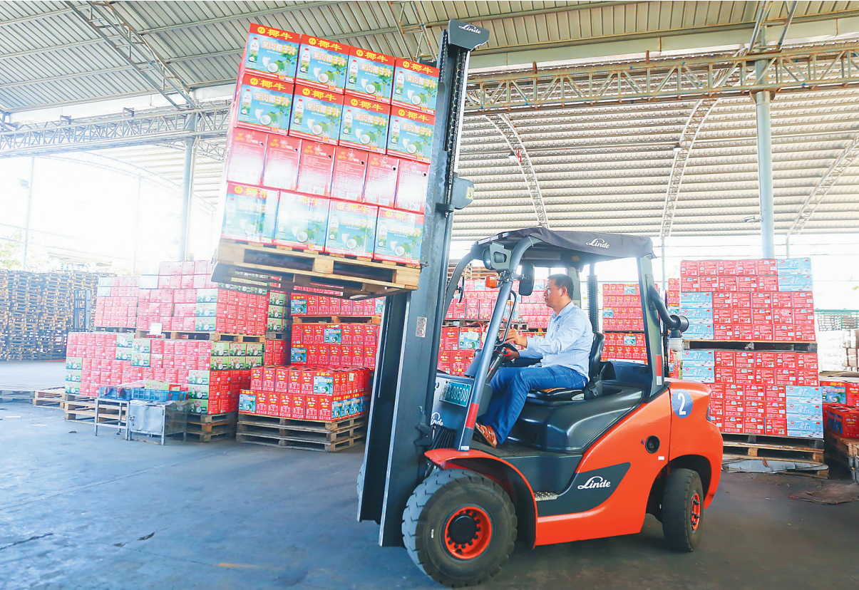
在海南新大食品有限公司,工人在装运椰牛饮料。