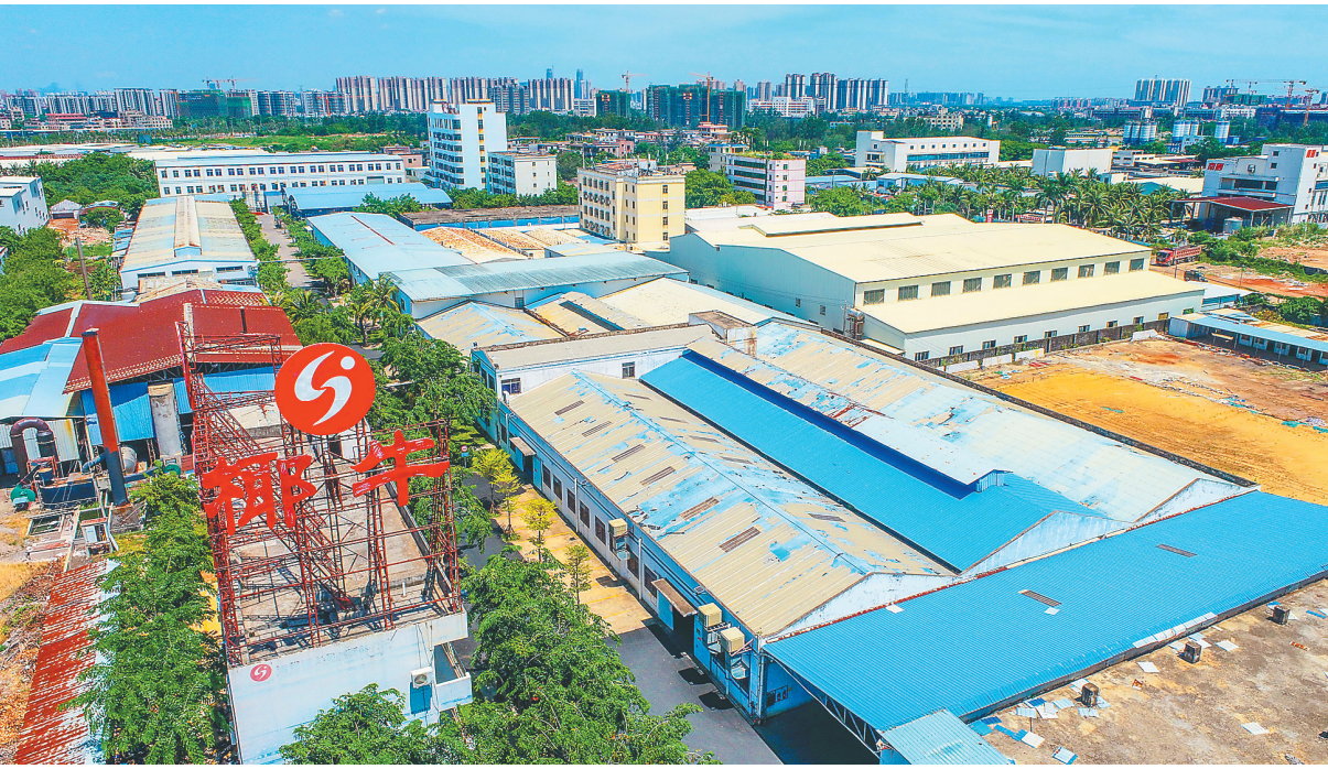
航拍海南新大食品有限公司厂房。