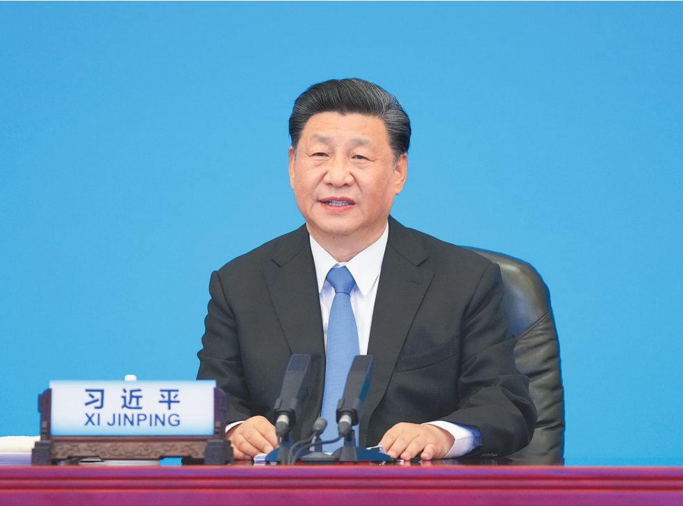
7月6日，中共中央总书记、国家主席习近平在北京出席中国共产党与世界政党领导人峰会并发表主旨讲话。