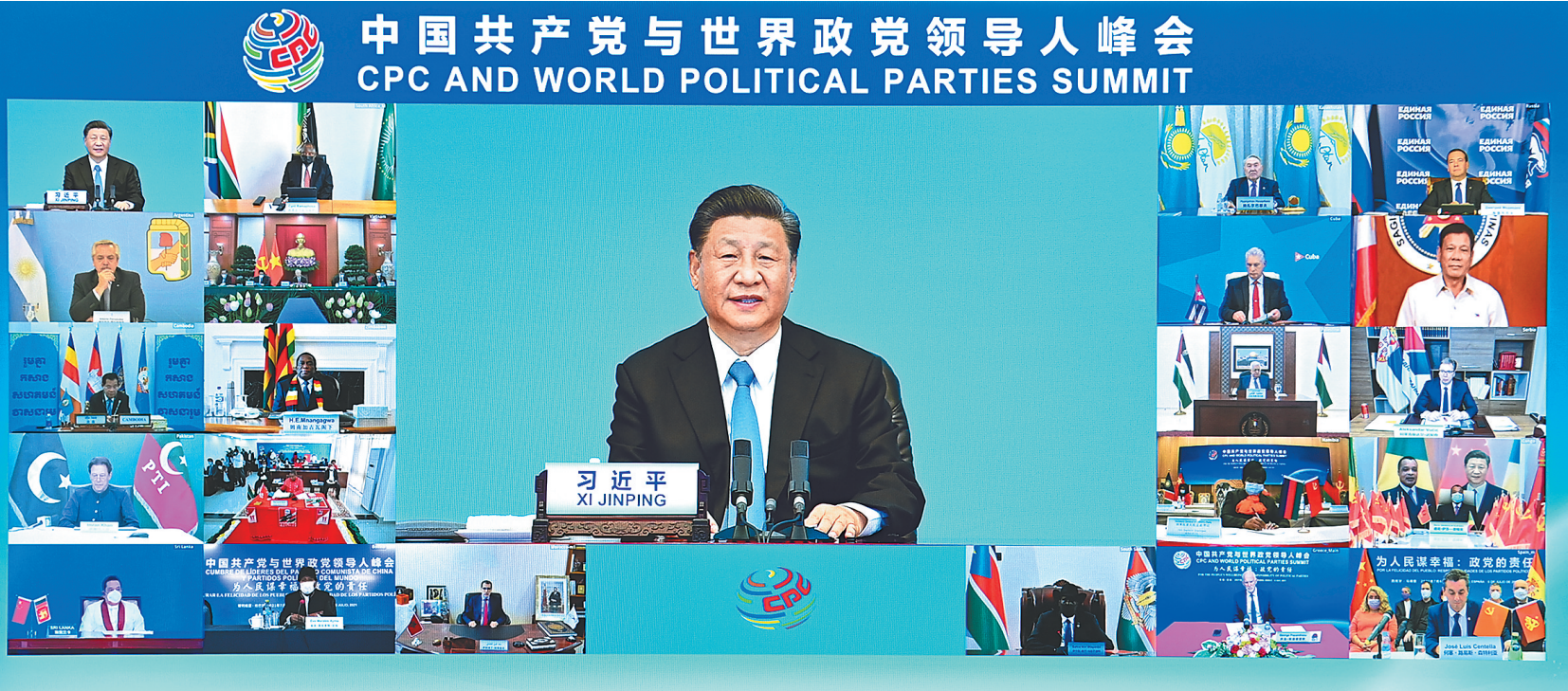
7月6日，中共中央总书记、国家主席习近平在北京出席中国共产党与世界政党领导人峰会并发表主旨讲话。

新华社北京7月6日电 中共中央总书记、国家主席习近平6日在北京以视频连线方式出席中国共产党与世界政党领导人峰会，并发表题为《加强政党合作 共谋人民幸福》的主旨讲话，强调政党作为推动人类进步的重要力量，要锚定正确的前进方向，担起为人民谋幸福、为人类谋进步的历史责任。中国共产党愿同各国政党一起努力，始终不渝做世界和平的建设者、全球发展的贡献者、国际秩序的维护者。 中国共产党与世界政党领导人峰会以“为人民谋幸福：政党的责任”为主题。峰会主会场设在人民大会堂金色大厅。金色大厅内，中国共产党党旗与参会的外国政党党旗交相辉映，呈现出壮观的党旗旗阵。会场上设置了五幅巨大的显示屏，充分展现世界各国政党领导人共聚“云端”、共谋大计、共话未来的生动场景。 习近平首先发表主旨讲话。他指出，中国共产党成立100年来，团结带领中国人民接续奋斗，推动中华民族迎来了从站起来、富起来到强起来的伟大飞跃。中国共产党坚持中国人民和世界各国人民命运与共，在世界大局和时代潮流中把握中国发展的前进方向、促进各国共同发展繁荣。 习近平强调，今天，人类社会再次面临何去何从的历史当口，选择就在我们手中，责任就在我们肩上。面对共同挑战，人类只有和衷共济、和合共生这一条出路。政党作为推动人类进步的重要力量，要锚定正确方向，担起历史责任。 第一，我们要担负起引领方向的责任，把握和塑造人类共同未来。大时代