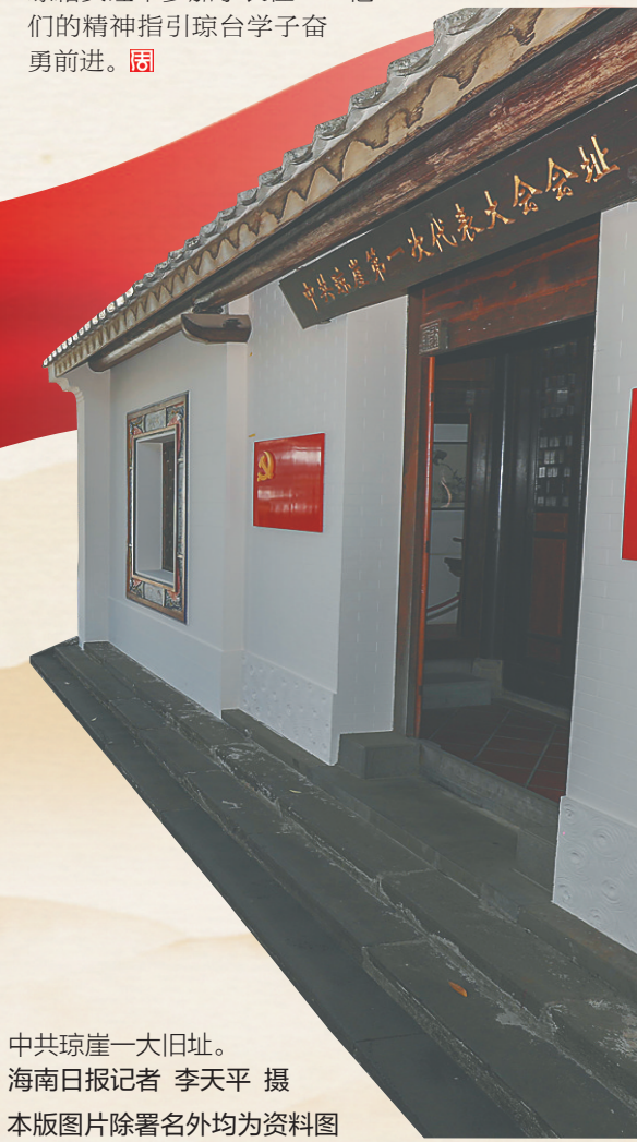
中共琼崖一大旧址。 海南日报记者 李天平 摄 本版图片除署名外均为资料图

《琼崖红旗》，时任琼崖特委书记的冯白驹，在第一期就发表了文章《琼崖群众对琼崖苏维埃第二次代表大会应有的认识》。 他在文中阐述了建立苏维埃政权的性质和重要性，并提出了今后的斗争任务是：“进一步深入土地革命，发展苏维埃区域，建立苏维埃政权，扩大红军，发展群众武装，以及联系到各种大小斗争，推广斗争范围，更有力地推进琼崖革命斗争向前开展”。 邢治孔说，冯白驹的文章号召力和感染力极强，对提高群众斗志、明确斗争方向起了重要作用，“时隔近百年，冯白驹等人所写的文章，读来依旧闪耀着思想光芒，令人思潮澎湃、倍受鼓舞，我们可以从中感受到早期琼崖革命家思想理论水平的高度。”■