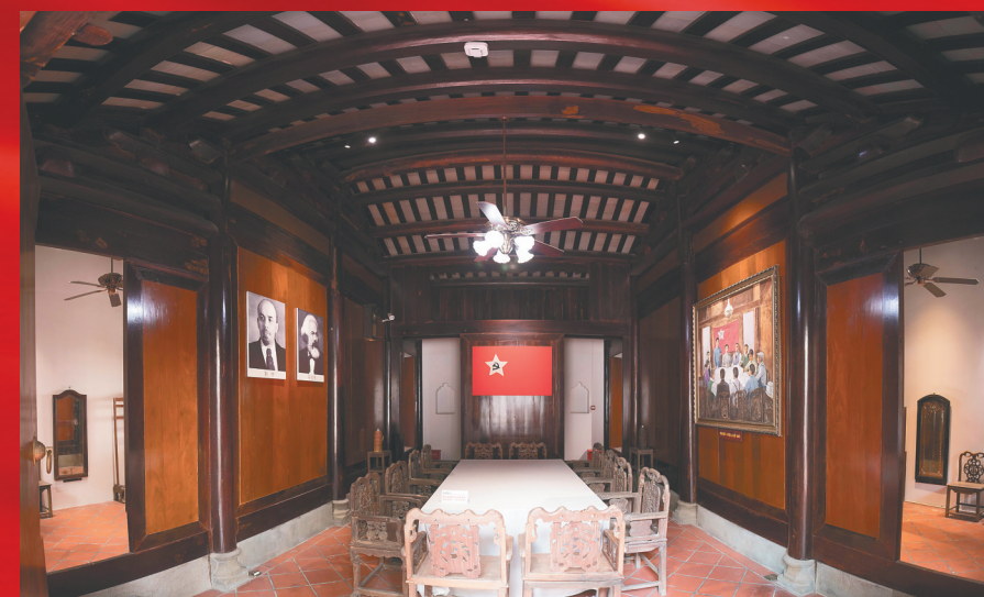
中共琼崖一大旧址。

中共琼崖一大参会人员平均年龄仅26岁，最年轻的地委青年部长罗文淹当时年仅22岁，最年长的地委书记王文明当时也只有32岁。 值得一提的是，在这次会议中当选琼崖地委委员的13名同志，有9名来自琼台师范学院前身琼崖中学或广东省立第六师范学校，分别是教师陈垂斌、罗文淹、罗汉、许侠夫，学生王文明、周逸、冯平、李爱春、陈德华。此外，包括杨善集以及为中共琼崖一大提供开会地点的“邱宅”主人邱秉衡，也都是琼台校友。 琼台书院博物馆（青年学生党校）临时负责人杨艳红说，其实，1926年2月，琼崖特支成立之初，广东省立第六师范学校就已经成为府城、海口一带培养青年党团员的核心阵地。吴明最早来到琼崖时，也以在该校教书为掩护开展革命工作。 琼崖特支高度重视发展和吸收青年学生加入团组织，派遣共产党员陈垂斌和罗文淹进入广东省立第六师范学校负责教学组织和思想道德工作，又派遣陈公仁、许侠夫、陈文晃、周汉光、吴亚衣、云石天、洪钟等先后进入学校任教。 1926年3月，中共六师党团支部成立，成为琼山县第一个党支部，广东省立第六师范学校学生郑景琛、魏宗周、韩财元、李泮标、苏汉亭等被批准入党。到当年年底，该校党员和团员人数达到190多人，占全校学生的五分之一。 杨艳红说，从响应五四运动到马克思主义在琼崖的传播，党团组织的创建，中共琼崖一大的召开，从土地革命到抗日战争、从解放战争到新中国成立，琼台校友们以母校为起点，不仅在琼崖革命事业中立下不朽功勋，还在全国革命征程中发挥了重要作用。 她举例，杨善集、王文明、冯平等创建了琼崖地方党政军组织；徐成章、徐天柄等参加辛亥革命和国民大革命；王海萍参加了南昌起义，领导了闽西暴动并参与创建闽西革命根据地，后任中共福建省委书记；周士第在南昌起义、长征时期、抗日战争和解放战争中战功显赫，开国后被授予上将军衔；谢飞作为唯一的琼籍女红军参加了长征……他们的精神指引琼台学子奋勇前进。■