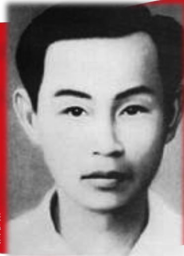
本版图片均为资料图