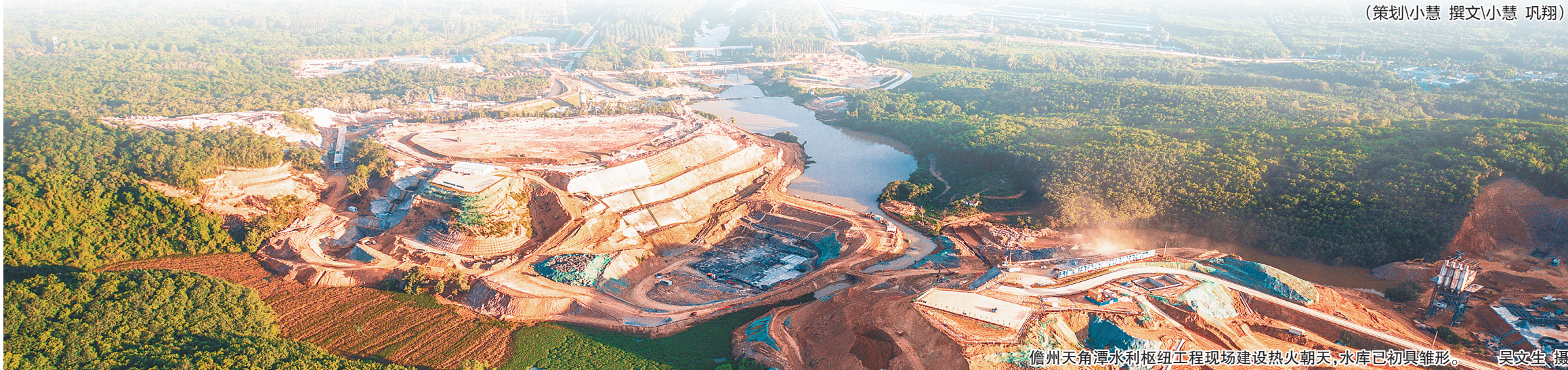
儋州天角潭水利枢纽工程现场建设热火朝天,水库已初具雏形。