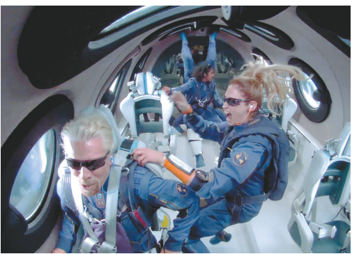
太空舱内体验试飞(视频截图)。

新华社洛杉矶7月11日电（记者谭晶晶 黄恒）英国维珍银河公司的“团结”号太空船11日完成首次满员太空试飞，向其商业太空游计划迈进一步。该公司创始人理查德·布兰森作为机组成员参与此次试飞。 美国东部时间11日约10时40分，维珍银河一架双体运输机载着“团结”号太空船从位于美国新墨西哥州的航天发射场起飞，在距地面约15千米的高空释放“团结”号。随后，“团结”号启动火箭发动机加速，数分钟后关闭发动机，借助惯性继续爬升。在到达距地面约86千米的最高点后，“团结”号缓慢转向、滑翔下降，最后顺利降落在发射场跑道。 这是维珍银河公司的第四次载人太空试飞，也是首次满员太空试飞，共搭载6人，包括该公司4名任务专家和2名飞行员。除布兰森外，另外3