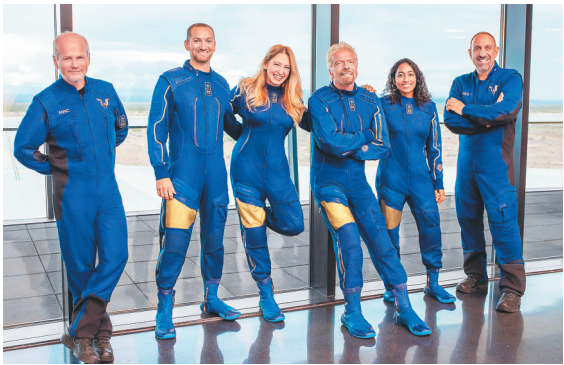
首次满员太空试飞成员的照片。