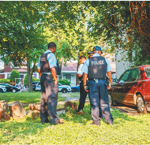
芝加哥枪击频发,图为警察查看一起枪击事件案发地。

美国媒体和专家认为,近来暴力犯罪激增的原因在于,经济疲软、疫情持续、枪支泛滥等多重因素相互交织、叠加,令社会矛盾不断加剧。而白宫的“药方”对于美国积重难返的“暴力病”能有多大治疗效果,令人怀疑。