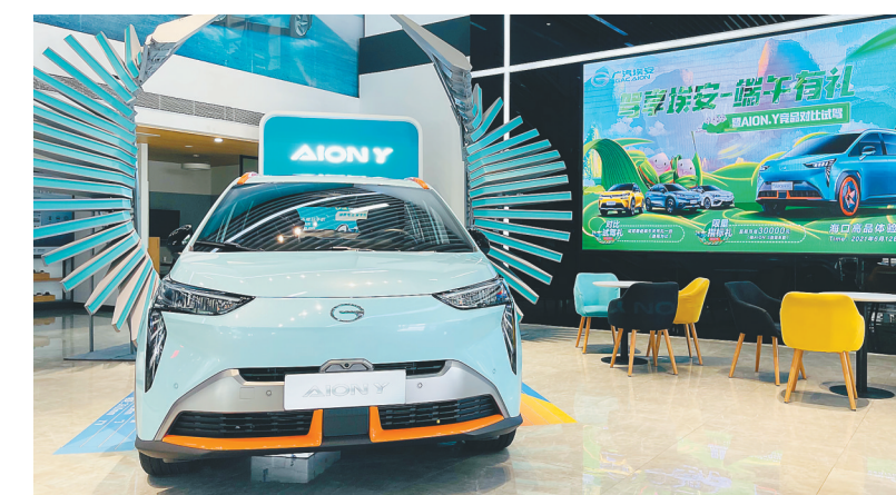
广汽埃安 AION.Y 车型。

APP,全程监控车辆出厂全过程,同时智能化、个性化等配置,可以让消费者得到更好的驾驶体验。最重要的是,目前,广汽埃安新能源汽车的销售,让消费者直接从厂家订车为主,销售价格越来越透明,越来越优惠,汽车销售网点更多的让利给消费者,侧重于为消费者提供相关配套服务。为了更好地服务海南全岛百姓,广汽埃安考虑在全省各个市县全面布局。