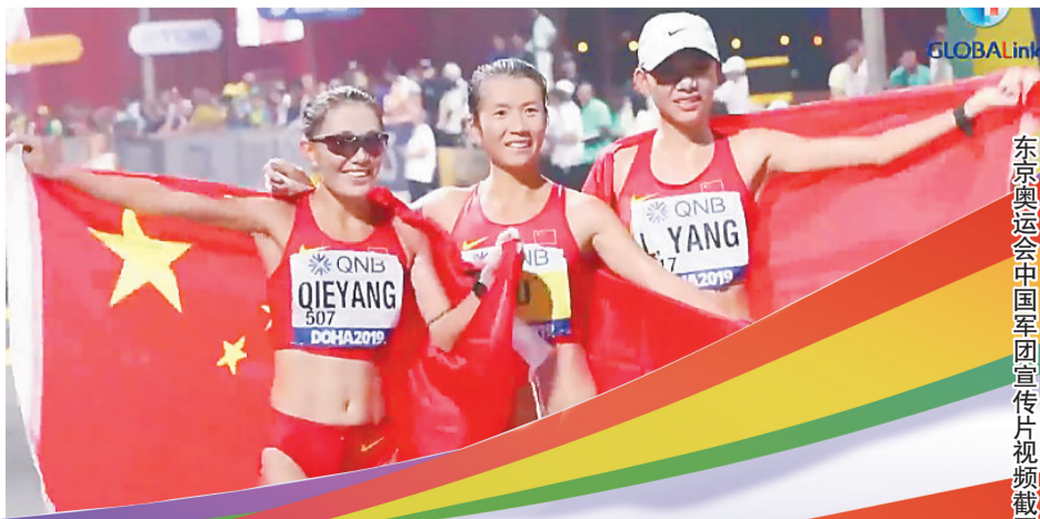
东京奥运会中国军团宣传片视频截图。