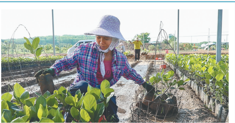
位于白沙黎族自治县的海垦龙江农场公司通过基地建设、产学研结合等举措，大力发展苗木产业。