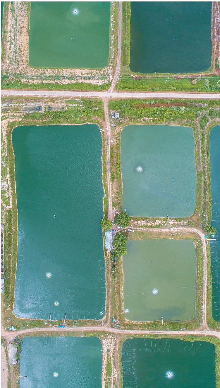
俯瞰文昌市东路镇的海垦东路农场公司鱼塘。

本报文城7月19日电 (记者邓钰 通讯员黄闻涛)举办垦地融合座谈会，共推重点项目、产业建设……近期，海南省农垦投资控股集团有限公司(以下简称海垦控股集团)与文昌市委、市政府频频“互动”，深化垦地融合发展。这是海南日报记者7月19日从该集团获悉的。