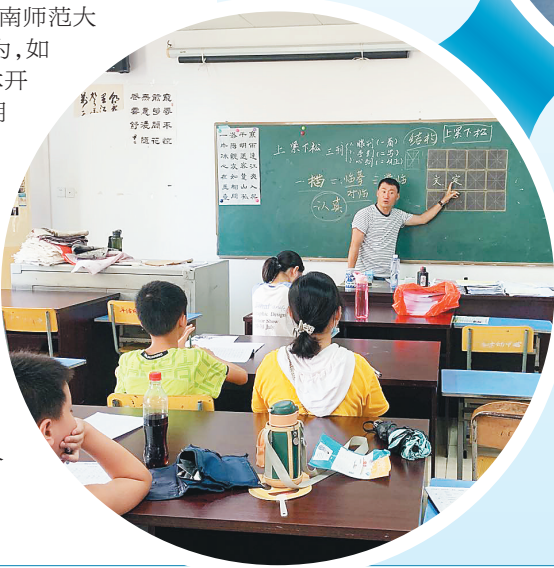
孩子们在海口市青少年活动中心公益课堂学习书法和打篮球。