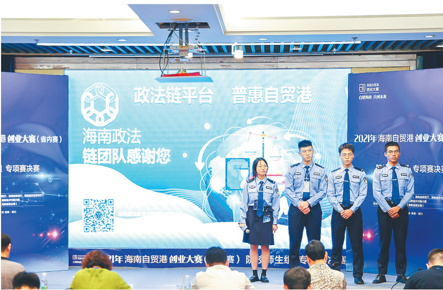
海南政法职业学院学生参加比赛现场。

“今年我们除了日常的培训工作，还积极开展党史学习教育主题培训。”该院继续教育部负责人介绍，他们发挥“海南省政法干部培训学院”党史教育职能作用，打造了一批精品党史专题培训课程，还采用多种培训模式，把理论教学与实