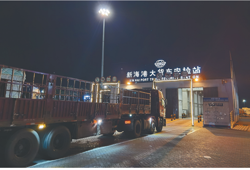
7月17日，在海口新海港，一辆货车正在通过安检通道。

侯志刚也说，如果各个环节都优化一下，过海时间应该还能压缩很多，比如是否可以开通网上微信缴费，开车过