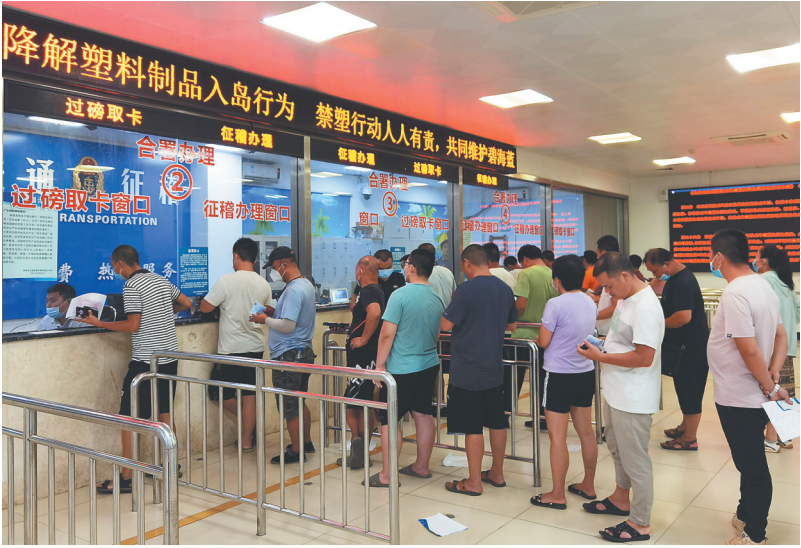
7月17日，在海口新海港过海货车售票处，货车司机正在排队办理业务。

“缴费后还不能直接上船，还要在现场等船。”直至22时30分，侯志刚才开车上了船，23时30分船起航后，他到凌晨1时30分才下船。侯志刚说，虽然前后耗时4个多小时，“但这