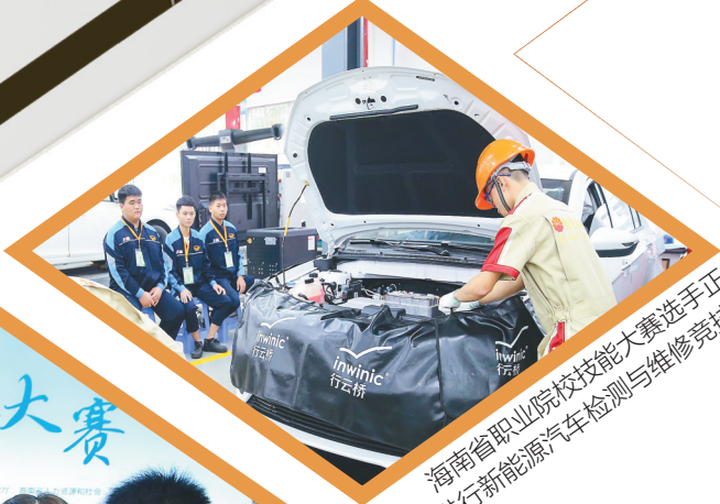
海南省职业院校技能大赛选手正在进行检测与维修竞赛。