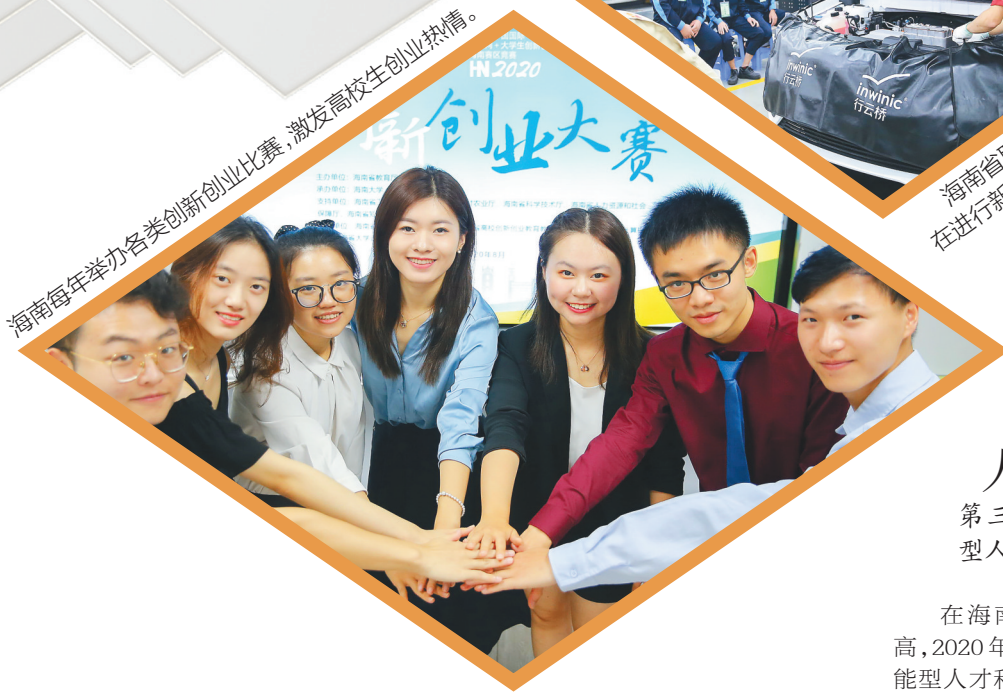
海南每年举办各类创新创业大赛，激发高校毕业生创业热情。

▲自贸港政策成毕业生留琼“吸金石” 海南提供70多项人才举措和“一站式”服务，86.34%的应届毕业生对政策有所了解