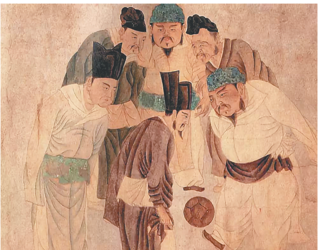
宋元之际画家钱选作品《宋太祖蹴鞠图》。