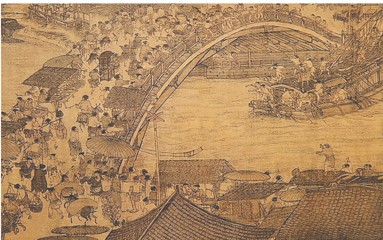
《清明上河图》中宋人观舟竞渡。