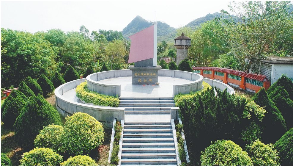
美合革命根据地纪念碑。

1940年1月，中共中央指示琼崖特委要建立山区根据地。接到指示后，琼崖特委决定西进，到五指山附近创建一块进能攻、退能守的山区根据地。当时，特委选中了临高、白沙交界的纱帽岭山区。