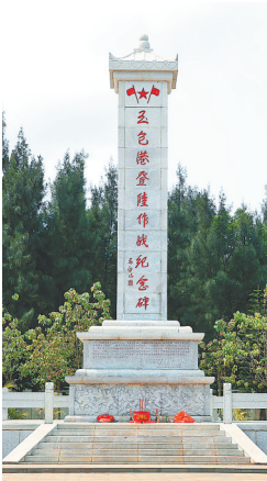
玉包港登陆作战纪念碑。