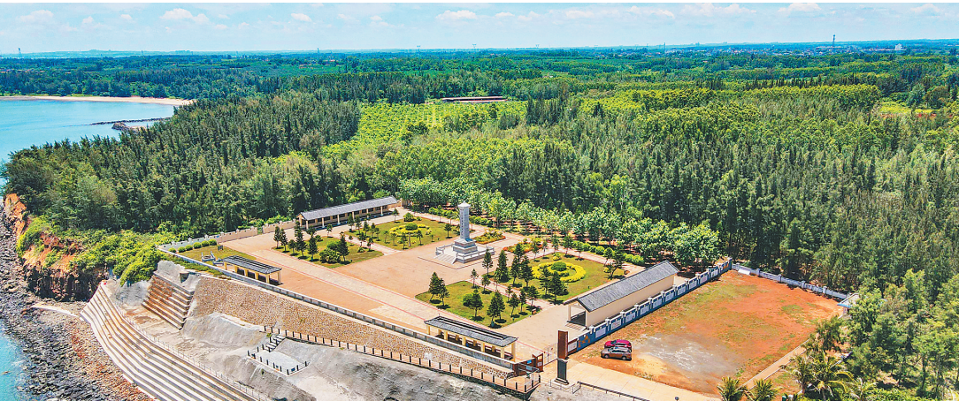
俯瞰玉包港登陆作战纪念馆。

1989年4月，为纪念中国人民解放军渡海部队在玉包港登陆作战中牺牲的烈士，澄迈县人民政府修建玉包港登陆作战纪念碑，马白山将军为纪念碑题写碑名。