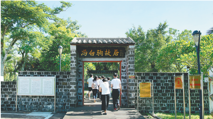
冯白驹故居。