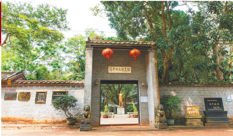
冯平同志纪念馆。

黎明即将到来。1950年4月，冯白驹率领特委、琼纵领导机关从毛贵挺进六芹山，靠前指挥各部作战。野战军第40军、43军在琼崖纵队的有力配合下，决战黄竹、美亭，一举摧毁了国民党号称“固若金汤”的“伯陵防线”，取得解放海南岛战役的胜利。■