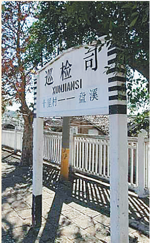
“巡检司”作为地名在我国西南地区还很常见。图为云南省弥勒市巡检司镇火车站牌,该镇还下辖一个巡检司村。(资料图)