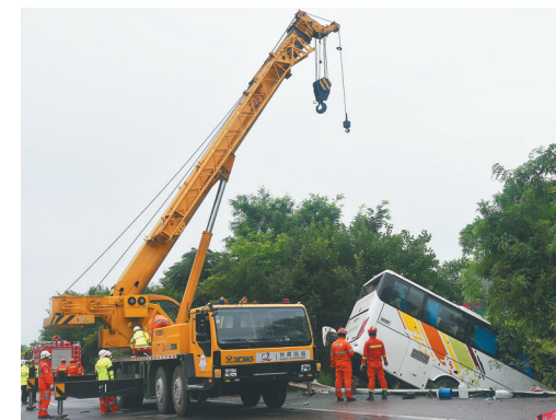
图为事故现场照片。

新华社兰州7月26日电(记者梁军、崔翰起)记者从甘肃省平凉市委宣传部了解到,26日14时,由郑州发往新疆大巴车(车牌号豫AX5006,核载63人,实载63人)行驶到平凉泾川境内(距泾川服务区500米处)发生侧翻。事故已造成13人死亡,45人送往医院救治,2人无碍。3名涉事人员已被控制。