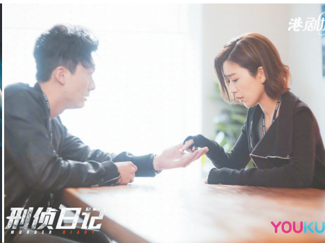
本文配图为《刑侦日记》海报和剧照