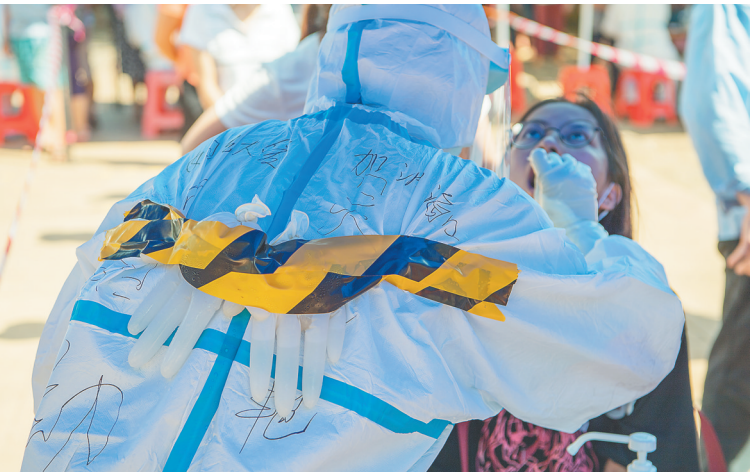
8月8日上午,在海口市琼山区云龙镇一核酸检测点,为了防暑,医护人员“背冰”上阵。