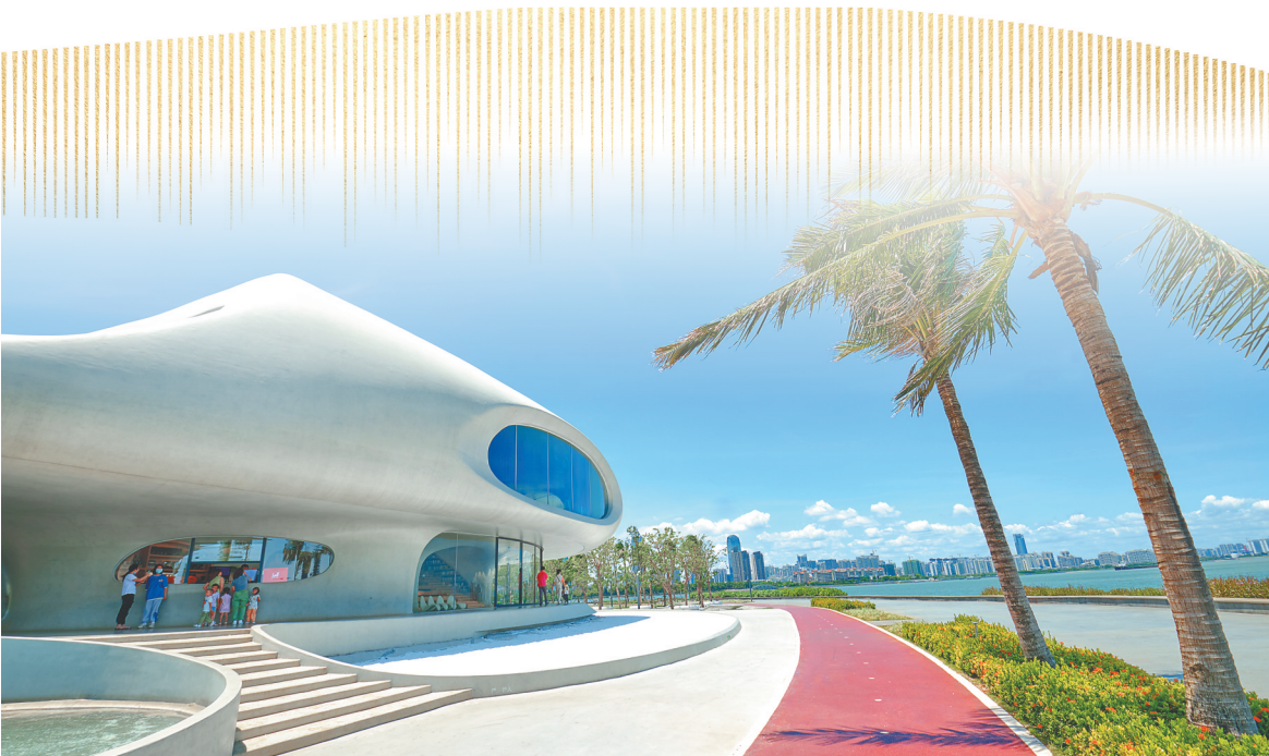
位于海口湾南岸的云洞图书馆。

“我们正在规划海口湾畅通工程的四期、五期，海口湾以后会变得更美！”海口资规局一位工作人员说。