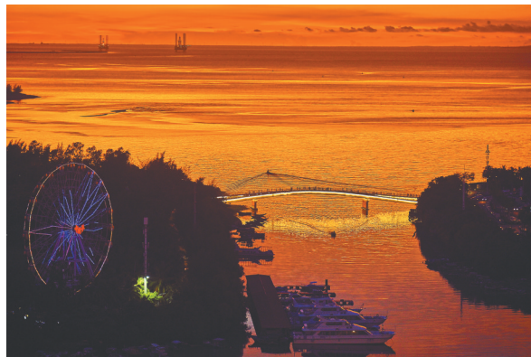
万绿园附近的海口湾。