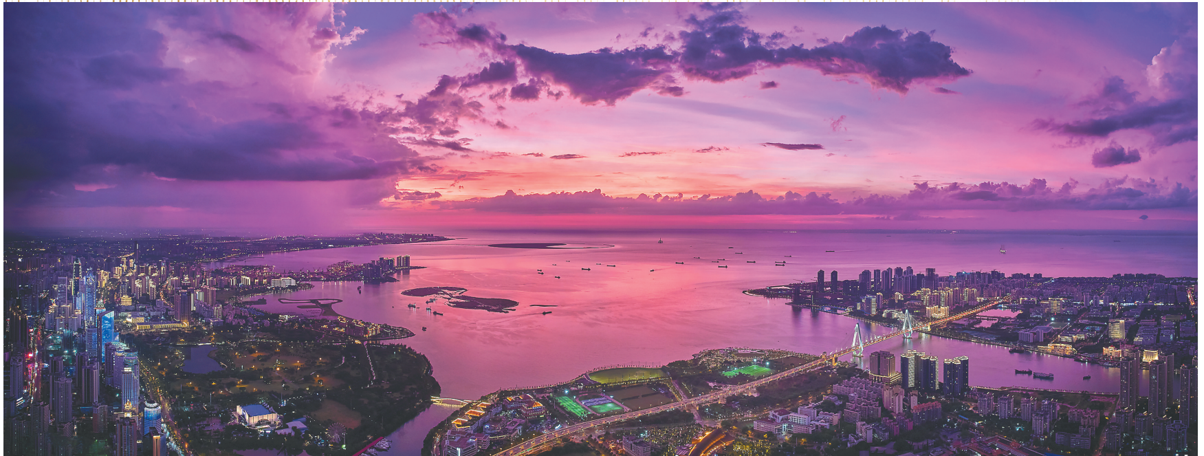
日落时分的海口湾两岸。