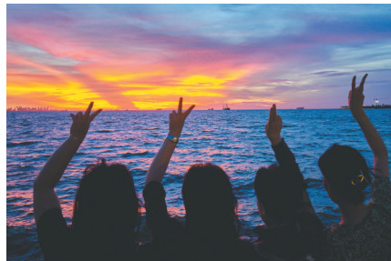
市民在海口湾观赏日落美景。