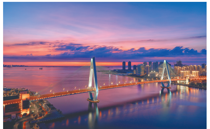
日落时分的海口湾世纪大桥段。