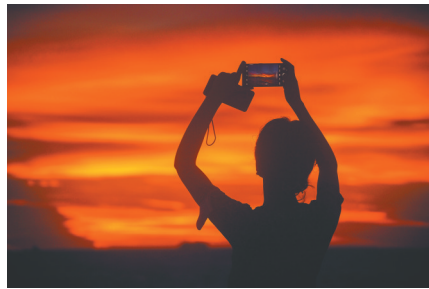
日落时分,市民在海口湾拍照。

每年5月到8月,是一年当中海口湾日落最好看的时候。傍晚时分,当太阳西沉,霞光在天边晕染开来,深红、浅红、桔黄、浅黄,把天际装扮得绚丽多彩。晚霞映照在湾区的海面上、建筑上、桥梁上,仿佛整个世界都镀了一层金。落日、云层、大海、桥组成的壮美景色,美得像一幅印象派大师笔下的油画。