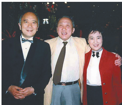
孙道临王文娟夫妻俩与黄宗江合影。