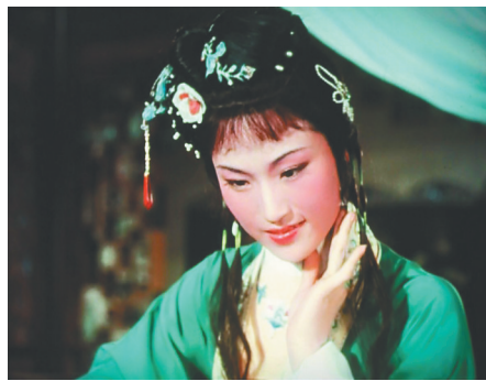
1962年电影《红楼梦》中王文娟饰林黛玉。