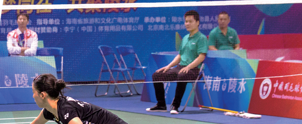
国家羽毛球队陵水训练基地常年服务于国家队冬训和各项赛事。