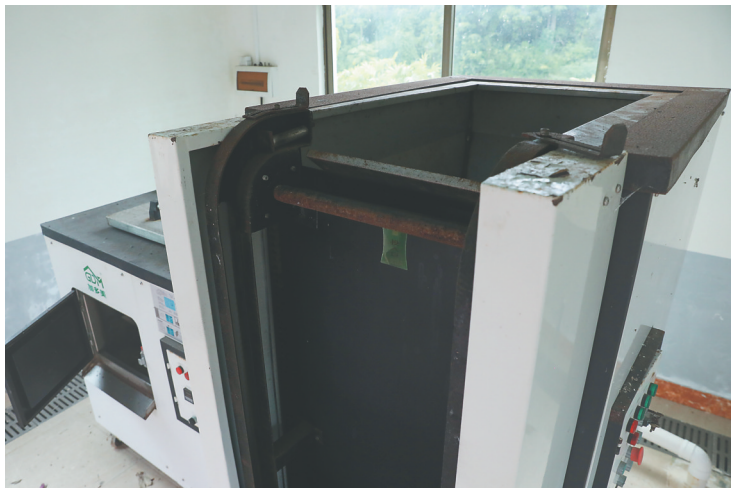
文昌市龙楼镇好圣村垃圾处理设施闲置。