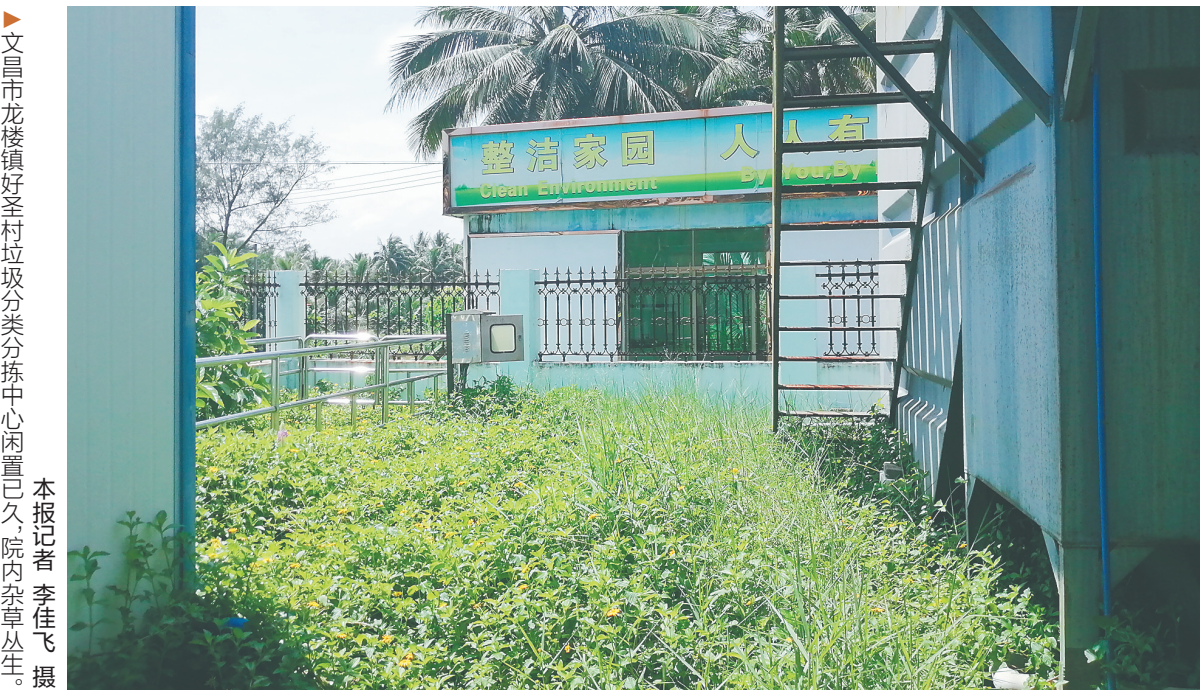
文昌市龙楼镇好圣村垃圾分类分拣中心闲置已久，院内杂草丛生。

垃圾一体化处理设备需要相对专业的人员维护和操作，这需要一笔不小的费用。目前，我们已与财政部门积极沟通，争取安排专项资金，优先保障生活垃圾分类等涉及生态环境保护的重点工作资金需求，力争于2021年底前全面启动垃圾分类示范点试运营工作。”符力说。 省住建厅相关负责人表示，农村生活垃圾分类示范点建设涉及用地和大量资金投入，文昌克服困难积极探索，各项工作走在全省前列，目前多个示范点的硬件设施基本完成。但由于管理运营存在资金缺口，项目尚未完成验收，因此没有投入使用。后续期待多方合力，共同解决资金难题，探索出一套可持续的管理运营机制，让生活垃圾分类示范点发挥真正的作用。 (本报文城8月15日电)