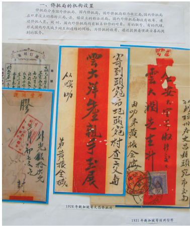
1928年华侨从新加坡寄回文昌的侨批。 资料图

万人,次为琼山、琼东、乐会、定安等县,具有数千人。” 1937年抗日战争爆发,中国社会秩序遭破坏。日军侵琼前夕,为避战祸,大批海南人拖家带口出逃南洋。据琼海关统计,到1939年,海南出洋人数达到5万人,他们有些从海口港、清澜港乘船前往南洋;有些先去湛江、再由琼侨总会救济帮助,前往新加坡、马来西亚、泰国等地。 抗战胜利后,海南人出洋的速度有所放缓,但出洋者仍络绎不绝。随着国共内战爆发,为躲避战火,海南人又开始大量出洋。海口至东南亚各地的船票一票难求,黑市上一张船票被炒至100光洋,许多人卖田典牛外逃“去番”。