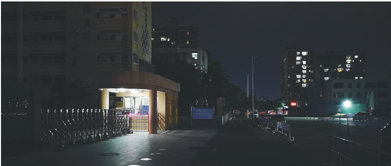
近日，由于路灯不亮，金南路上的省农垦二小校门口一片漆黑

金南路道路建设业主单位海口城建集团对此回应称，金南路道路路灯等附属工程原计划在2021年6月份前完成，但由于道路设计年限较长(2013年9月至2020年8月，中间曾因征地问题停工6年)，部分设计已不符合现行规范，设计图纸未设立单独路灯供电箱变，致使金垦路路灯接电需与周边道路供电箱变或小区供电箱变进行协商接电。另外，由于该项目建设持续时间久，也导致项目施工单位管理人员变动较大，多次对接未果，致使目前道路路灯已安装完成但尚未接电。