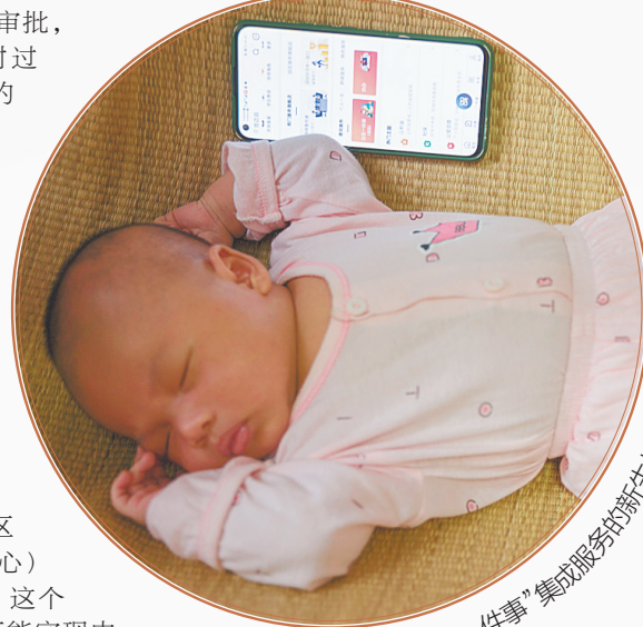
澄迈县受益于“出生一件事”集成服务的新生儿。