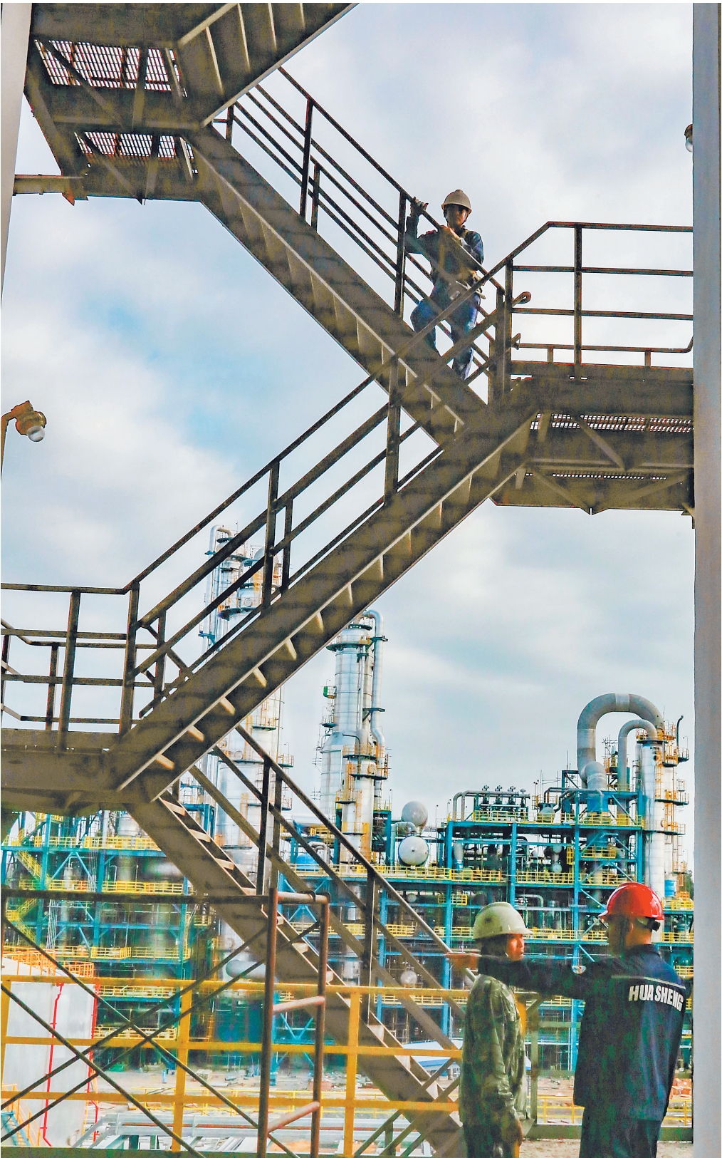
在东方市政府部门的支持和贴心服务下,海南华盛新材料科技有限公司项目建设加快推进。