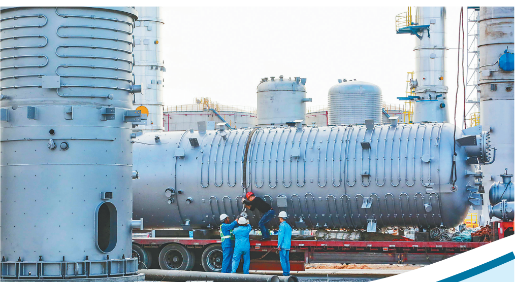
在东方市临港产业园内的华盛聚碳酸酯项目,工作人员加紧安装设备。