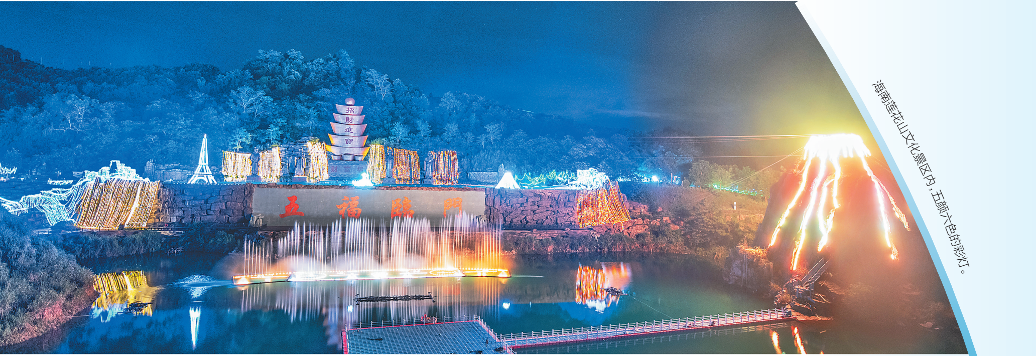
海南莲花山文化景区内，五彩大色的彩灯。