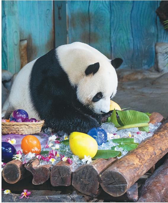
“贡贡”在品尝“生日蛋糕”。