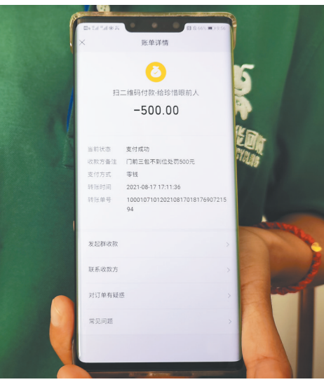
梁虹展示向私人微信号“珍惜眼前人”缴纳罚款的记录。

发现，当天最先进入废品回收店内的两名执法人员中并没有吴坤铭，吴坤铭为最后从巡逻车上下来的执法人员。当天实际执法的两名人员均为协管人员。但《海口市城市管理综合行政执法条例》中明确，综合行政执法协管人员不得从事行政处罚和行政强制工作，其职责为配合综合执法人员进行宣传教育、巡查、信息收集、违法行为劝阻等辅助性事务。