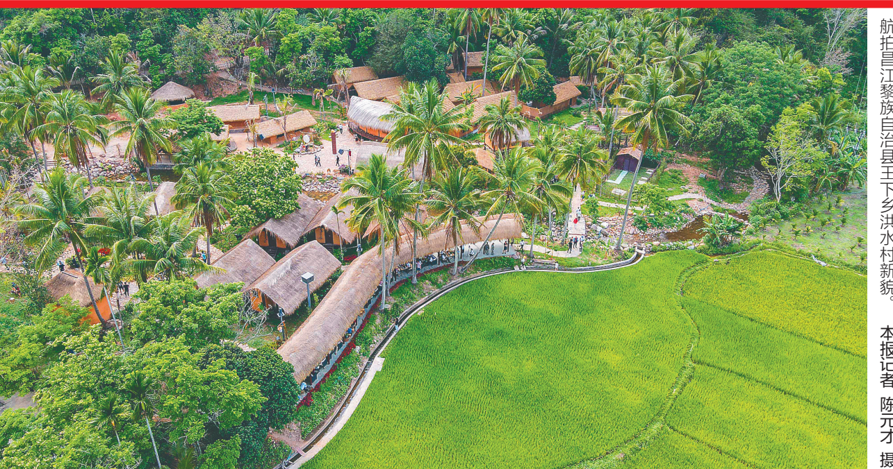
航拍昌江黎族自治县王下乡洪水村新貌。

氧和VOC浓度，系统施策治理水环境，推进农业清洁生产。要突出“四个重点”，加快推进国家生态文明试验区标志性项目建设，科学积极稳妥推进“双碳”工作，探索绿水青山就是金山银山的海南实现路径，推动形成绿色生产生活方式。 沈晓明指出，要准确把握保护与发展的关系，深刻认识生态环境是营商环境的重要内容，良好的生态环境是可转化为旅游、渔业等产业发展的重要资源，发展塑料替代品等生态环保举措是推动高新技术产业发展的重要动力。要进一步压实责任，创新工作方法，建立健全治本长效机制和公众参与机制，完善高质量发展考核体系，以更加严实的作风，抓好生态环境保护工作。