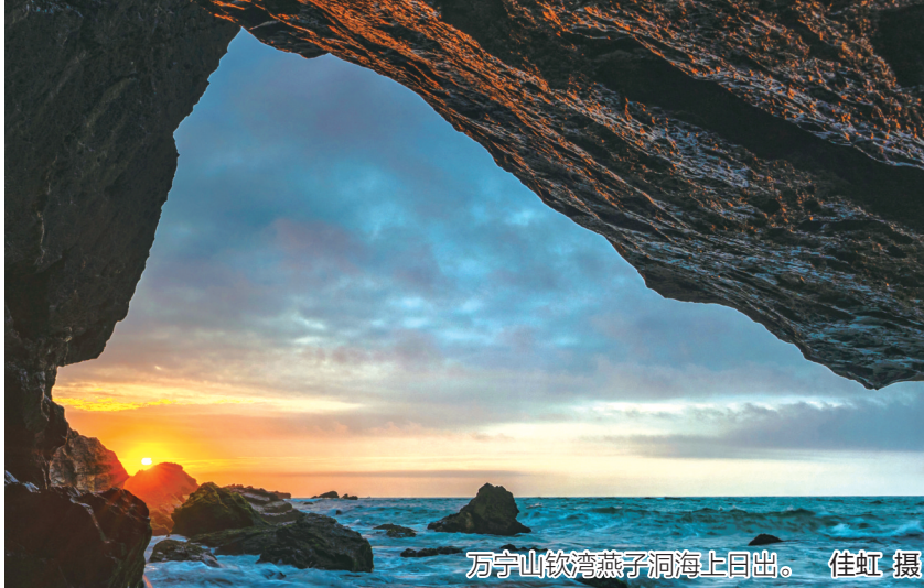
万宁山钦湾燕子洞海上日出。