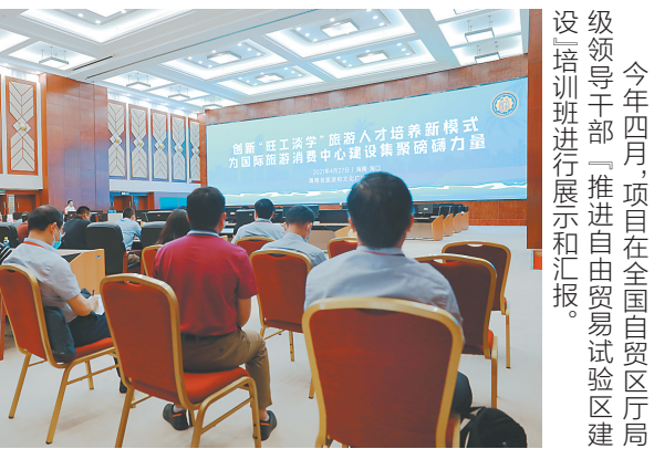
今年四月,项目在全国自贸区厅局级领导干部“推进自由贸易试验区建设”培训班进行展示和汇报。

（一）品牌化 进一步加强“旺工淡学”品牌化建设,设计“旺工淡学”标识系统和宣传口号,强化品牌形象宣传,将“旺工淡学”项目打造成为国内外旅游职业教育知名品牌。 （二）标准化 大力推进“旺工淡学”旅游业人才培养的标准化建设,筹建“旺工淡学”人才项目教学管理数据系统,编制统一规范的项目教材、课件、案例库、培训证书,打造国际领先的旅游职教培养模式,将“旺工淡学”项目打造成为国内外旅游职教标准化建设的标杆。 （三）平台化 借助海南自贸港建设的东风,加大与“一带一路”沿线国家的合作力度,推动国际旅游职教平台的建设,加强与国际社会旅游职教的交流合作,联合培养面向国际的旅游新型人才;进一步破除部门壁垒,加强部门、协会、企业、院校的协作融合,畅通协作渠道,大力推进“旺工淡学”旅游人才培养合作提质增效。 （四）国际化 按照“面向国际、服务全球”的发展理念,推动“旺工淡学”项目国际化发展,建立高水平的国际职业技能等级认定评价机构,适时出台《海南省“旺工淡学”旅游人才培养项目职业技能等级证书认定办法》,争取突破现行机制,逐步建立起接轨国际、通用性强的全行业资格认证体系,培养一批国际型的旅游人才。 海南省旅游人才培养已经迈入新征程,在海南自由贸易港全速推进的进程下,将进一步加快推动“旺工淡学”项目的品牌化、标准化、平台化和国际化建设,全面促进旅游人才培养提质升级,奋力将该项目打造成为立足海南、面向国内、辐射国外的海南自由贸易港国际旅游职教平台。